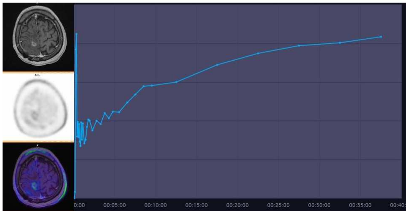
Slika 1: Rastoča krivulja aktivnosti v benigni spremembi

Senzitivnost ^{18}\text{F} -FDOPA za opredelitev ponovitve glioma je podobna kot pri ^{18}\text{F} -FET PET [98], vendar je specifičnost 6-[ ^{18}\text{F} ]FDOPA manjša zaradi lažno pozitivnega kopičenja v vnetnih procesih (specifičnost ^{18}\text{F} -FDOPA 62% v primerjavi s ^{18}\text{F} -FET). Tudi fiziološki privzem ^{18}\text{F} -FDOPA v striatumu lahko ovira oceno obsega tumorja.