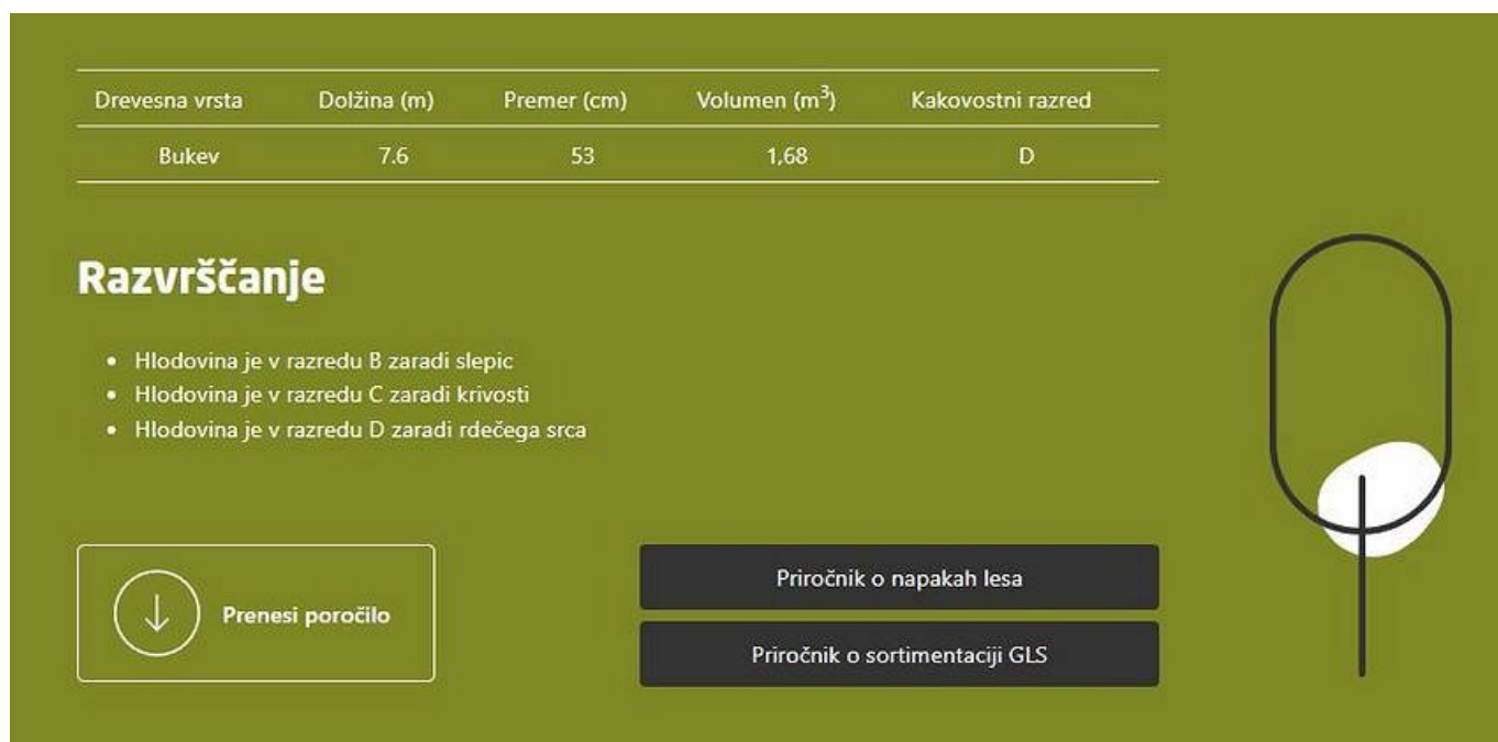
Slika 2: Povzetek meritve

V spodnjem levem kotu se nahaja gumb »Prenesi poročilo«. Uporabnik si lahko v .PDF formatu shrani povzetek zadnje meritve na svojo napravo. Na desni strani pa sta v pomoč uporabniku dodani še povezavi do Priročnika o napakah lesa in Sortimentaciji gozdnih lesnih sortimentov.