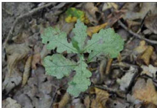
Slika 6: Močan napad hrastove čipkarke ( C. arcuata ) na naravnem hrastovem podmladku v Krakovskem gozdu Figure 6: Intense infestation of the oak lace bug ( C. arcuata ) on the natural oak young growth in Krakovski gozd.