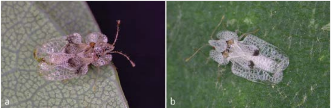
Slika 1: Primerjava odrasle a) hrastove ( Corythucha arcuata ) in b) platanove čipkarke ( C. ciliata ) Figure 1: Comparison of an a) adult oak lace bug ( Corythucha arcuata ) and b) sycamore lace bug ( C. ciliata )

prekriva vratni ščit (pronotum), ki je napihnjen in ob straneh listasto razširjen. Vratni ščit in prvi par kril sta prosojna, značilno čipkasto strukturirana in z drobno nazobčanim robom. Na sprednjem delu kril in na vratnem ščitu ima odrasla hrastova čipkarka rjave do črne lise. Jajčeca so drobna, črna in sodčasta (Slika 2b). Iz njih se izležejo sive do črne ličinke (nimfe), ki imajo po telesu številne trnaste izrastke (Kavčič, 2018, de Groot in Kavčič, 2020).