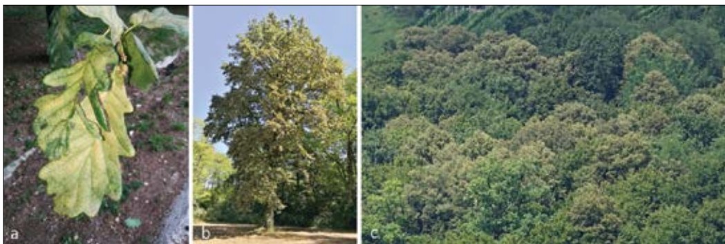
Slika 5: a) Bledenje oz. rumenjenje hrastovih listov zaradi napada hrastove čipkarke, b) ob močnem napadu hrastove čipkarke je opaziti porumenelost celotnih krošenj, ali c) celotnih sestojev.

Figure 5: a) Fading or yellowing of oak leaves due to the infestation with oak lace bug, b) on the intense infestation of the oak lace bug, the yellowing of entire tree crowns or c) of entire stands can be observed.