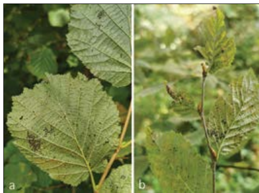
Slika 4: Na območjih z veliko gostoto populacije hrastove čipkarke ( Corythucja arcuata ) smo osebkke našli tudi na drugih drevesnih vrstah – npr. na a) leski in b) gabru. Figure 4: In the areas with a high density of the oak lace bug population ( Corythucja arcuata ), we found specimens on other tree species, too – e.g. on a) hazel and b) hornbeam.

Zelo redko se stenice prehranjujejo tudi na nekaterih drugih vrstah listavcev, kot so javor ( Acer spp.), brest ( Ulmus spp.), šipek ( Rosa spp.), lipa ( Tilia spp.), jerebika ( Sorbus spp.), leska ( Corylus spp.), kostanj ( Castanea spp.), gaber ( Carpinus spp.), malinjak ( Rubus spp.), navadna bukev ( Fagus sylvatica ) in sadno drevje (npr. Malus spp.) (Csóka in sod., 2019, Kovács in sod., 2020). Csóka in sod. (2019) so prepoznali skupno 29 vrst listavcev, ki niso iz rodu Quercus , ki se pojavljajo kot gostitelji C. arcuata . Čeprav vpliv teh vrst na razvoj in preživetje osebkov še ni raziskan, pa so omenjene vrste kot potencialni gostitelji zelo pomembni vsaj pri širjenju hrastove čipkarke na nova območja.