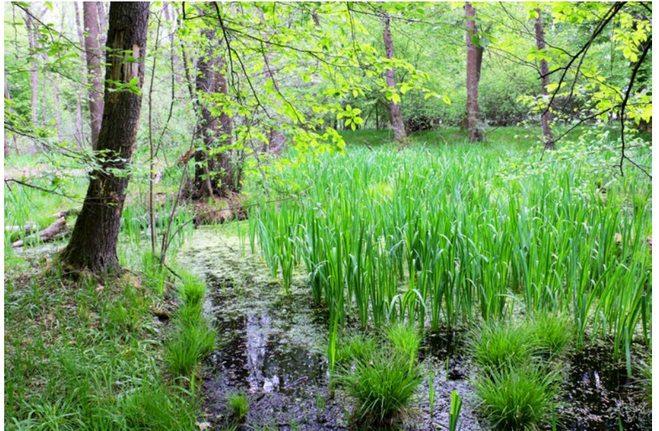
Primer razmeroma dobro ohranjenega sestoja črne jelše v Cigonci pri Slovenski Bistrici. (29. 4. 2020)

Za orientacijo na terenu in zanesljivejše kartiranje sestojev izbranih habitatnih tipov smo uporabljali mobilno aplikacijo QField s prikazom različnih prostorskih slojev, kot so digitalni barvni ortofoto posnetki izbranih območij, meje območij