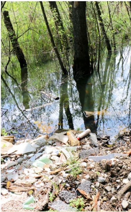
Nekateri obrečni jelševi gozdovi v Cigonci, ki je del območja Nature 2000 Ličenca pri Poljčanah, so onesnaženi z različnimi gradbenimi in drugimi odpadki, včasih tudi zelo nevarnimi. Odlaganje odpadkov povzroča onesnaženje, močno spreminja lastnosti gozdnih rastišč in ogroža dolgoročni obstoj tega prednostnega habitatnega tipa. (6. 5. 2020)

prvotno vzpostavljena na 104 hektarjih površin. Z natančnejšim pregledom gozdnih sestojev in terenskim kartiranjem v okviru projekta pa smo habitatni tip potrdili samo na 26 hektarjih. Velik del teh površin je bil potrjen tudi izven sedanjih con. V večini kartiranih gozdnih sestojev tega habitatnega tipa prevladuje črna jelša (črnojelševja), zelo redko pa ozkolistni jesen in različne vrbe. Razmeroma redki sestoji bele in drugih vrb se lahko pojavljajo tudi v ozkih pasovih ob vodotokih med kmetijskimi površinami. Na osnovi terenskega ogleda smo ugotovili, da je na tem območju zelo malo dobro ohranjenih sestojev tega habitatnega tipa.