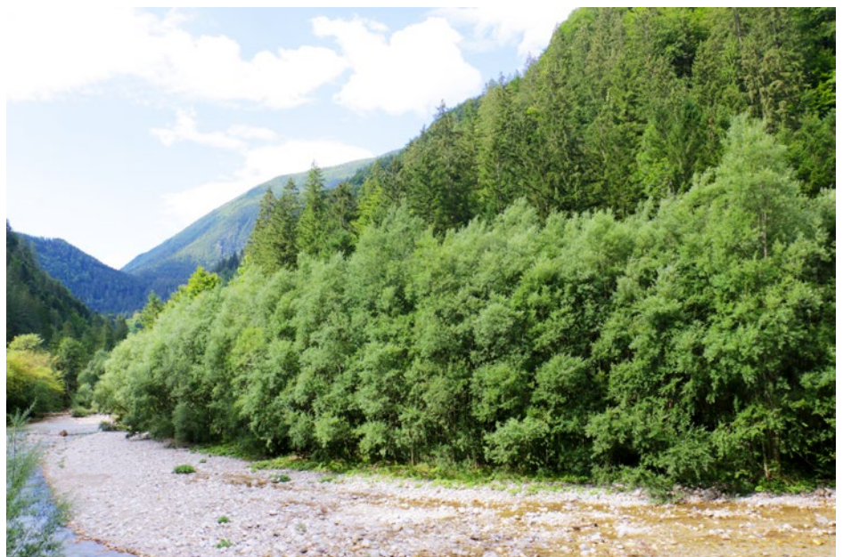
Redek primer razmeroma strnjene sestoja sive vrbe ob Savinji v bližini Luč. (19. 8. 2020)

Gozdovi, ki smo jih uvrstili v ta habitatni tip, so zaradi različnih dejavnikov v neugodnem ali celo slabem stanju. Na projektnem območju Boč-Haloze-Dončka gora in tudi sicer drugod po Sloveniji jih pogosto ogroža glivična bolezen jesenov ožig, ki povzroča sušenje in odmiranje jesenov.