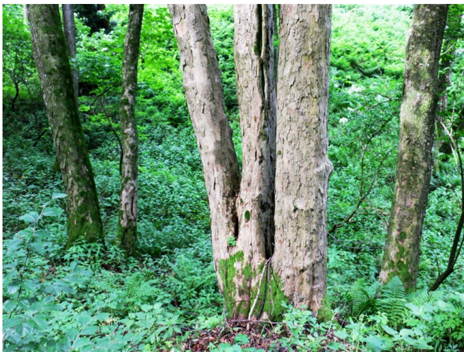
Sestoj s prevladujočim gorskim javorjem na severnem pobočju Boča z bogato pritalno vegetacijo. (16. 6. 2020)

Kartiranje je bilo izvedeno v sklopu LIFE integriranega projekta za okrepljeno upravljanje Nature 2000 v Sloveniji – LIFE-IP NATURA.SI (LIFE17 IPE/SI/000011), ki ga sofinancirajo Evropska unija v okviru programa LIFE, Ministrstvo za okolje in prostor ter partnerji. Več o projektu na http://www.natura2000.si . ☞