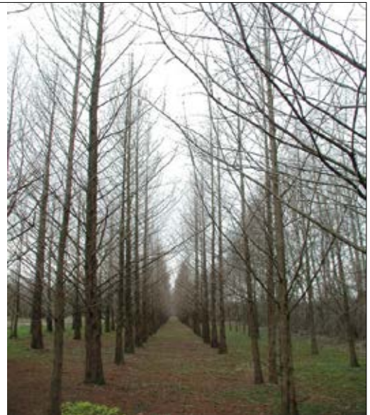
Slika 3: Levo: skica načrta zasaditve živega arhiva pri Zadobrovi iz leta 1994 (Božič, 1994), desno: stanje v nasadu tik pred redčenjem spomladi leta 2006