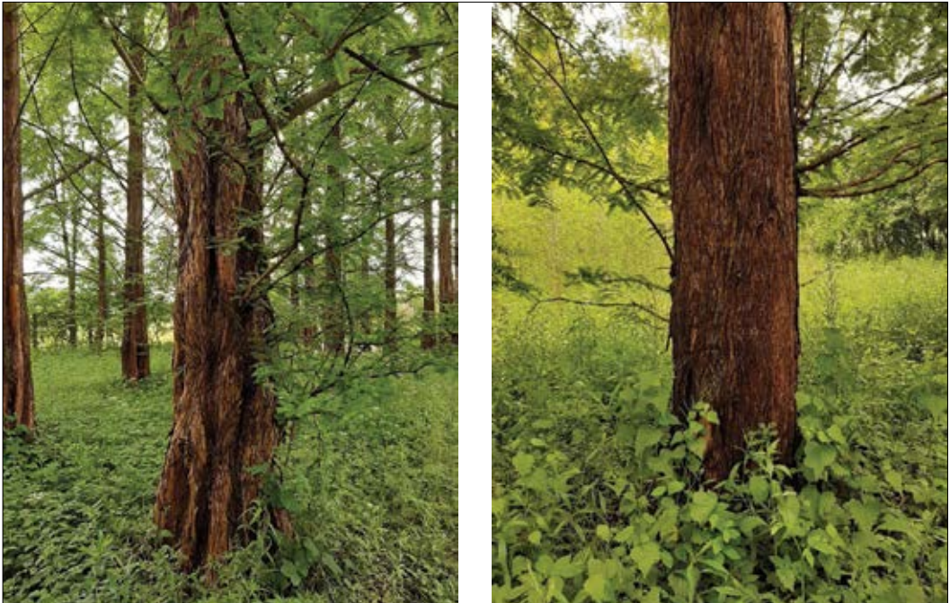
Slika 5: Levo: izredno užlebljeno deblo z dodeljeno oceno užlebljenosti 4 (foto: I. Petek), desno: neužlebljeno deblo (dodeljena ocena užlebljenosti 1) (foto: I. Petek)