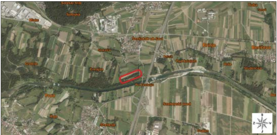
Slika 2: Digitalni ortofoto posnetek (DOF) nasada metasekvoje ob reki Savi (vir: ZGS..., 2020)