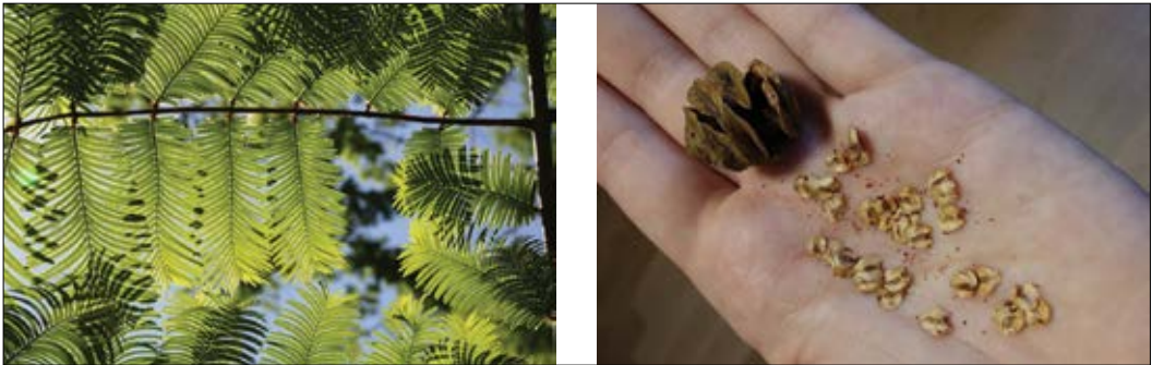
Slika 1: Levo: metasekvojini listi, desno: metasekvojini storž z nekaj izpadlimi semeni Figure 1: Left: dawn redwood leaves, right: dawn redwood cone with seeds

Kmalu po odkritju so semena (slika 1) s Kitajske poslali po svetu. Prvo metasekvojo zunaj Kitajske so leta 1948 posadili v Bostonu, istega leta so jo prinesli v Evropo (Ma, 2002; Brus, 2012). Danes je metasekvoja v Sloveniji že bolj razširjena v parkih in arboretumih in je pretežno vzgojena iz posameznih osebkov z vegetativnim razmnoževanjem doma ali v tujini, vendar je zelo težko najti sledi o njenem izvornem poreklu.