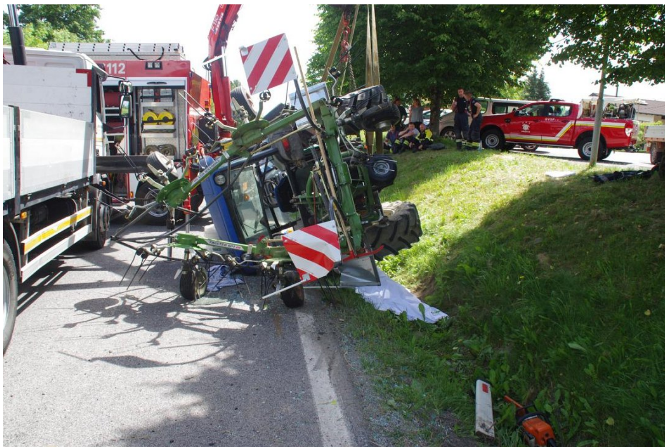
Prometna nesreča 22.6.2021 na cesti Postojna – Hruševje. Nalet osebnega avtomobila, prevrnitev traktorja in padec voznika, ki ni uporabljal varnostnega pasu, iz kabine pod traktor, kjer je je umrl.

odstotkov nezgod s smrtnih izidom poleg navedenih s traktorji in pri delu v gozdu. To so nezgode z drugimi stroji, zastrupitve, nezgode v zgradbah, pri delu z živalmi. Tako po tej metodologiji k lanskim 17 smrtnim nezgodam pri delu s traktorji in pri delu v gozdu prištejemo (zaokroženo) še 3 nezgode in dobimo skupaj 20 nezgod s smrtnim izidom.