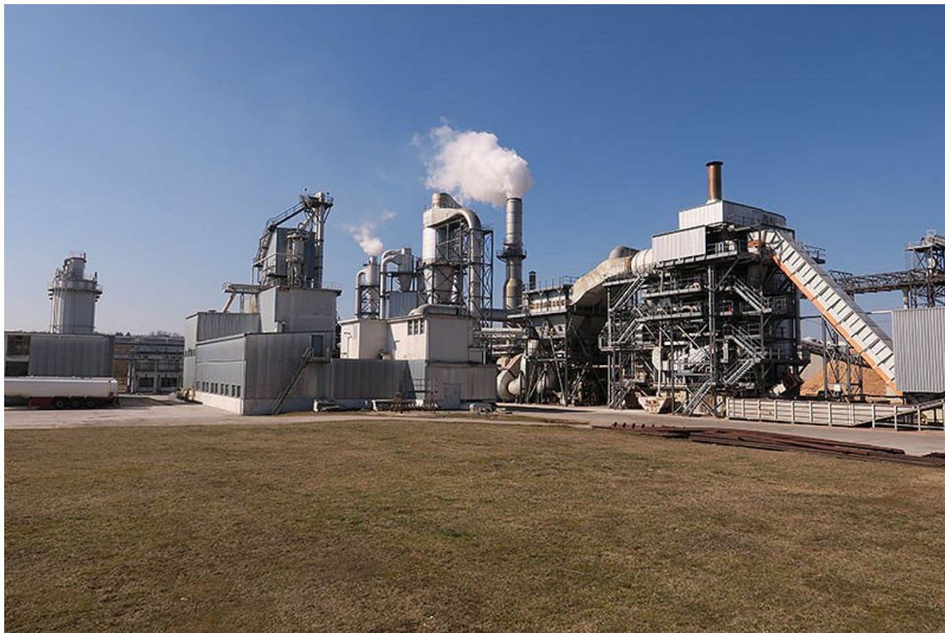
Tovarna Lesonit d. o. o.

obrat matične družbe Fantoni s. p. a. v Osoppu.