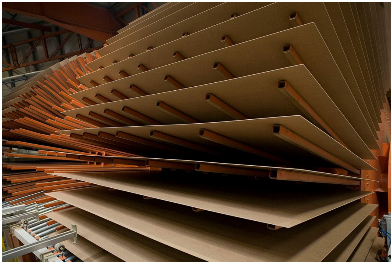
Vlaknene plošče tovarne Lesonit d. o. o.

V letu 2020 je za proizvodnjo vlaknenih plošč poraba lesa znašala okrog 200.000 ton lesa, v lanskem letu se je poraba lesa povečala na okrog 240.000 ton. Za proizvodnjo vlaknenih plošč tovarna predeluje okrogli les (ki prevladuje z več kot 70 %), lesne ostanke (žamanje in druge žagarske kosovne ostanke) ter lesne sekance (ki jih bodisi proizvedejo sami bodisi jih kupijo). Proizvodnja vlaknenih plošč je bila v lanskem letu rekordna in je znašala nekaj manj kot 200.000 ton oz. 136.000 m 3 .