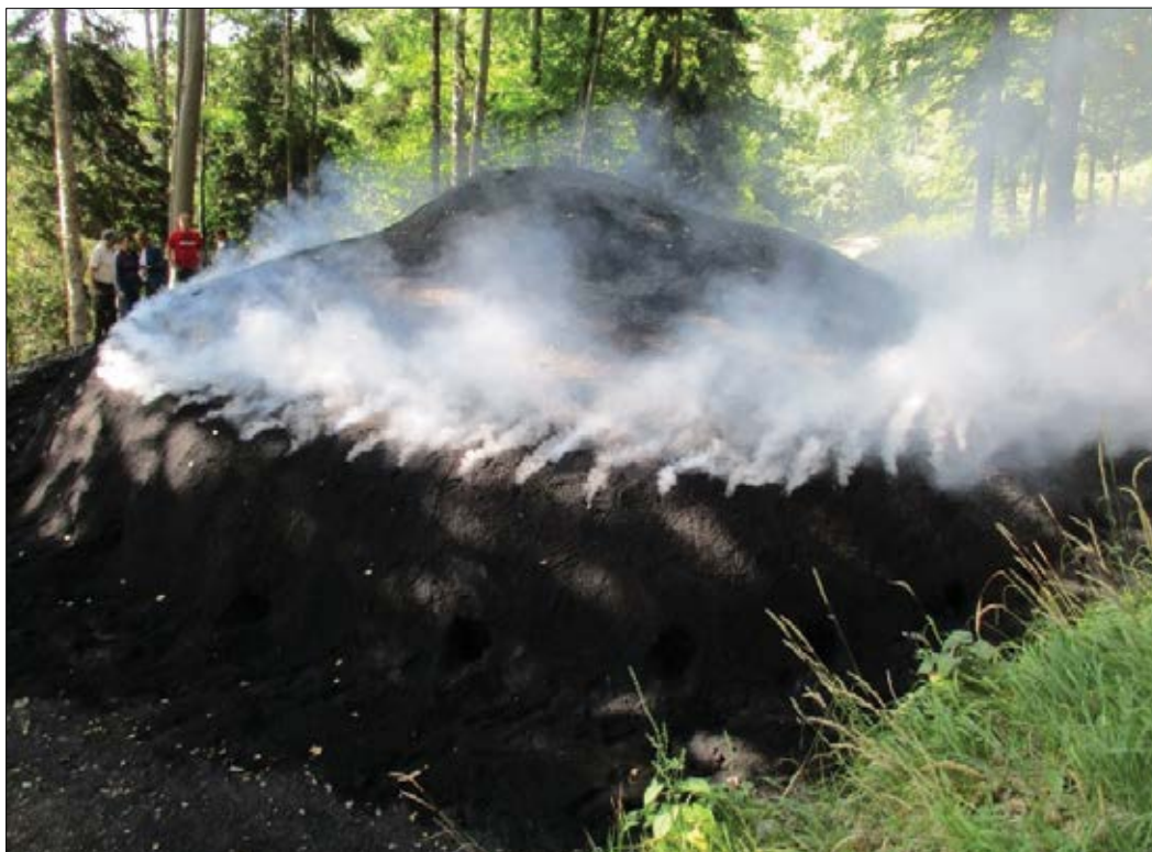
Slika 4: Kopa velikanka

Leto 2021 je bilo za slovensko oglarstvo, še posebno pa za Oglarsko deželo izjemno. Na kmetiji Medved so postavili kopo velikanka, največjo oglarsko kopo doslej na svetu. 300 prostorninskih metrov