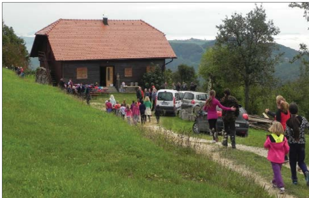
Slika 6: Hiša na Magolniku