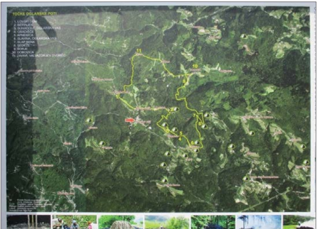
Slika 3: Oglarska dežela.