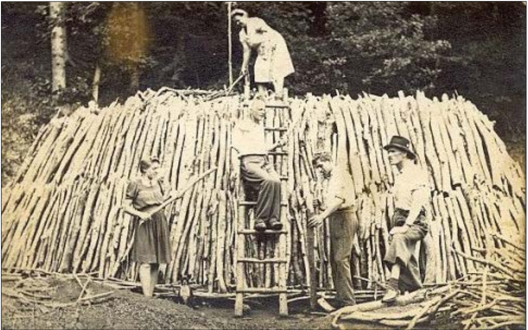
Slika 2: Postavljanje oglarske kope.