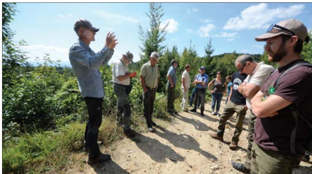
Slika 5: Udeleženci ekskurzije na Jatni

Jatna - Med Svibnim in Magolnikom je kompleks državnih gozdov, del revirja Jatna Dole in spada v gozdnogospodarsko enoto Radeče. Tu smo se z našo ekskurzijo ustavili pri vprašanih nege gozda ob primeru mešanega mladovja, kjer skupaj z lastnikom gozda preizkušajo nov način - situacijsko nego. Z večkratnim, vendar koncentriranim ukrepanjem, so omogočili razvoj svetloljubnih vrst - gradna, breka, češnje, gorskega javorja, gorskega bresta. Lahko rečemo, da je nega gozda temeljno delo v gozdne revirju in s tem temeljno delo revirnega gozdarja.