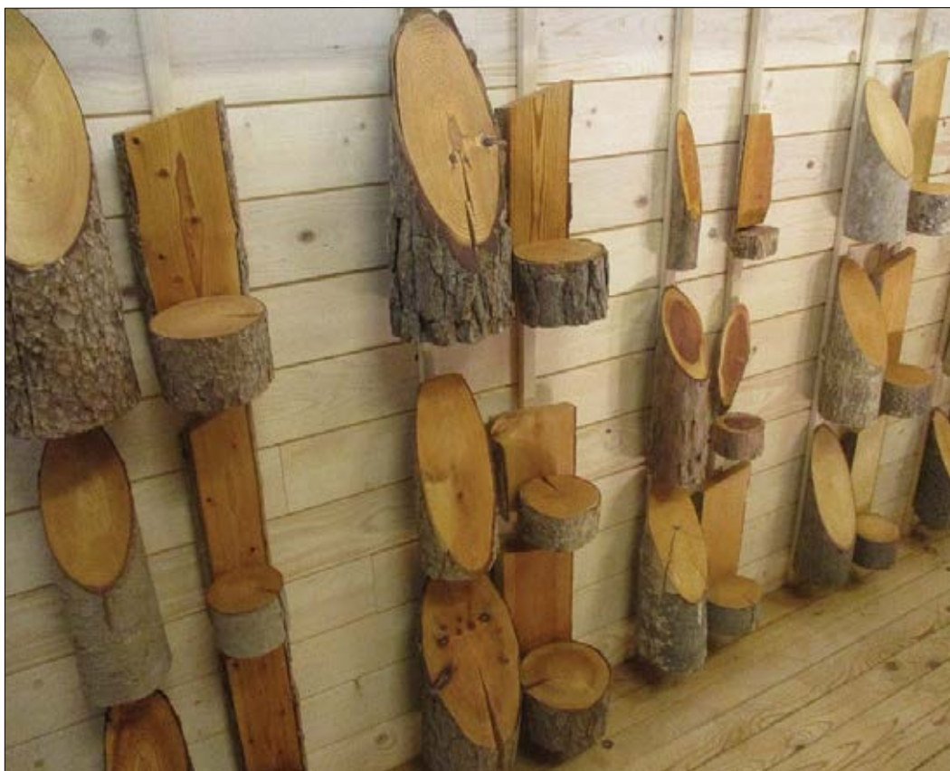
Slika 10: Mizarstvo Kos, Lesarius, razstava vrst lesa

Leta 2013 so ustvarili dokumentarni film Abrahamov ključ Srca Slovenije, ki prikazuje izkušnjo povezovanja slovenske vasi za prihodnost. Leta 2012 so skupaj z drugimi prejeli dobili evropsko nagrado za razvoj podeželja. Skupaj s partnerji so izdali knjigo V poslanstvu dreves, v kateri so zbrali razmišljanja ljudi, ljudi, ki s svojim delom in mišljenjem prinašajo v naš prostor dober zgled. Zdaj s partnerju delajo na projektu Lesarius. Namen projekta je spodbujati doživljanje narave, gozda, lesa z vsemi čutili. Sem