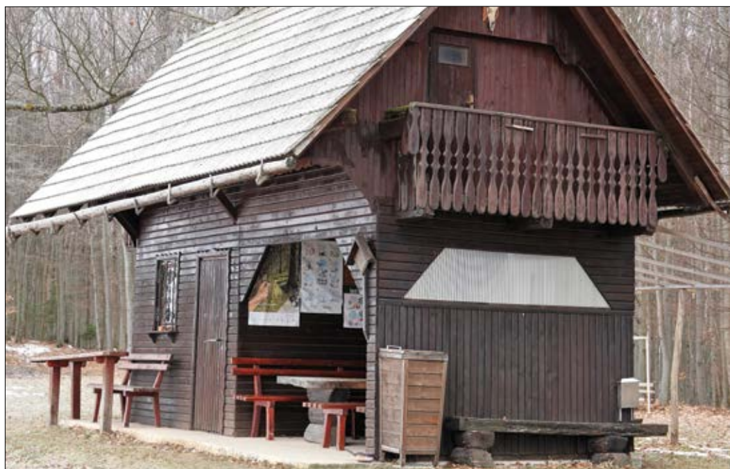
Slika 7: Bivak na Magolniku.