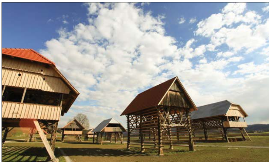
Slika 1: Dežela kozolcev.

Najbolj znana oglarska kraja v Sloveniji sta Sv. Mohor v Selški dolini in Oglarska dežela na Dolah pri Litiji. Oglarska dežela na Dolah pri Litiji je po številu oglarskih kop in proizvodnji oglja največje oglarsko območje v Sloveniji. Tu je na dobrih 2000 ha gozdov do 30 kop letno in oglari 16 oglarjev. Največja oglarska kmetija je