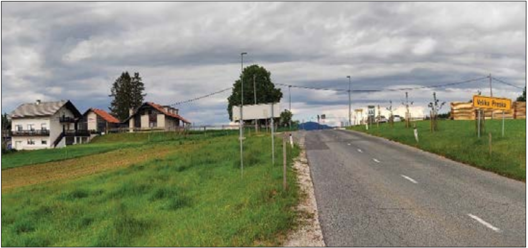
Slika 8: Velika Preska