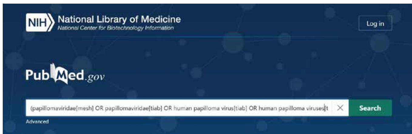
Slika 2: Iskalni izraz v iskalniku PubMed