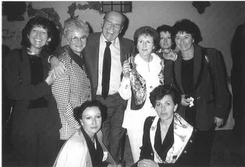
Slika 2. Prof. dr. Umberto Veronesi prisrčno pozdravlja slovenske predstavnice združenja Europa Donna na konferenci v Firencah

organizacij. Europa Donna zastopa interese evropskih žensk v boju proti raku dojke in seznanja predstavnike oblasti in vlade s problemi v zvezi s to boleznijo. Opozarja na potrebe po izboljšanju ali uvajanju nacionalnih programov in služb za boj proti raku dojke. Europa Donna se financira s članarino nacionalnih združenj in s sponzoriranjem.