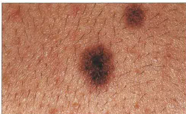
Slika 2. Klinično atipično pigmentno znamenje, večje od 6 mm, značilno nehomogene barve (večja lezija).