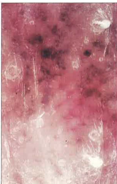
Slika 7. Grudasta, nepravilna razporeditev pigmenta in razširjene krvne žilice v novo nastali pigmentaciji (100-kratna povečava) pri začetnem lentiginoznem melanomu.