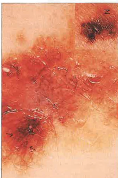
Slika 6. Klinično atipični pigmentni nevus, ki je nepravilne oblike, polciklično omejen in nehomogeno pigmentiran (slika v kotu). Dermatoskopsko je videti na periferiji značilno radiarno širjenje pigmenta, značilno za povrhnje raztezajoči se melanom.