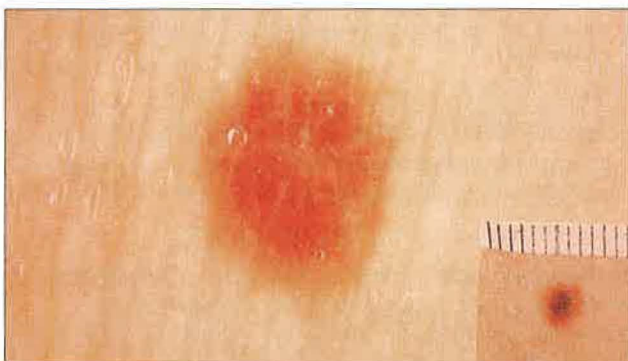
Slika 4. Navadni pigmentni nevus, kot ga vidimo s prostim očesom (slika v kotu) in ob 10-kratni povečavi. Enakomerna pigmentiranost, ki postopno prehaja v okolno kožo.