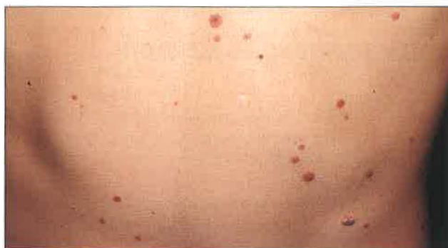
Slika 1. Številni pigmentni nevusi na koži trebuha.