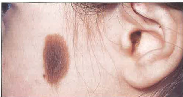
Slika 3. Prirojeni pilozni pigmentni nevus, ki ni nevaren.