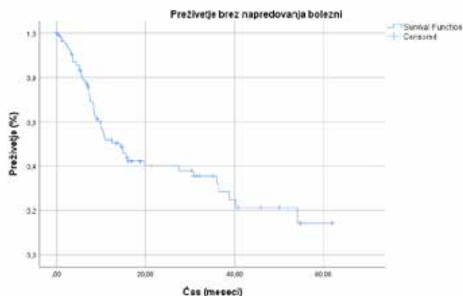
Slika 2: Preživetje brez napredovanja glede na vrsto mutacijo v genih BRCA.