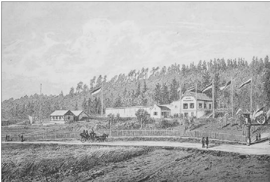
Slika 2: Strelišče Društva ostrostrelcev (Rohrschützengesellschaft) pod Rožnikom je bilo zgrajeno leta 1876. V parku strelišča je od 1. januarja 1880 do 31. decembra 1891 delovala državna gozdna drevesnica. Zakupno pogodbo je z društvom sklenil deželni gozdni nadzornik V. Goll. Zdaj je na tem mestu stavba Gozdarskega inštituta Slovenije na Večni poti (vir: Zgodovina društva – Društvo Ostrostrelcev).

Da bi lahko uspešno pogozdovali Kras, je bilo treba urediti vzgojo gozdnih sadik. Tako so namesto številnih majhnih drevesnic leta 1874 pod Rožnikom v Ljubljani, ki je imela takrat okoli 27.000 prebivalcev, osnovali centralno državno gozdno drevesnico za pogozdovanje Krasa na Kranjskem. Z vzgojo so začeli leta 1874, prve sadike pa so oddali leta 1876. Drevesnico so sestavljali trije, med seboj ločeni deli. Del zemljišča, ki je obsegalo