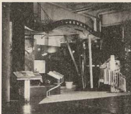
Razstavni prostor EKO STIL-a na sejmu pohištva v Ljubljani 1992.

Če opremljate novo stanovanje, obnavljate staro ali če želite posodobiti pisarne, lokale ali druge bivalne prostore, pridite v naš prodajni salon v BTC Ljubljana, Šmartinska 152, Hala A8, tel. 061 440-436 ali pa se zglasite na sedežu firme na Slovenski 56, Ljubljana, tel. 061 312-290.