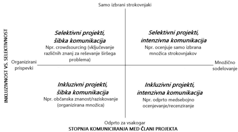
Shema 4: Širjenje občanskega raziskovanja. Prirejeno po Uhlmann in drugi, 2019: 715.