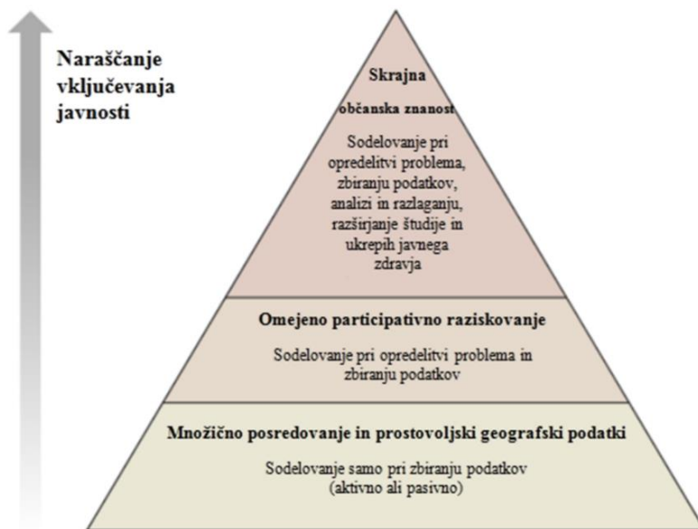
Shema 3: Piramida participativnega (sodelovalnega) raziskovanja. Vir: English, Richardson in Garzón-Galvis, 2018: 337.