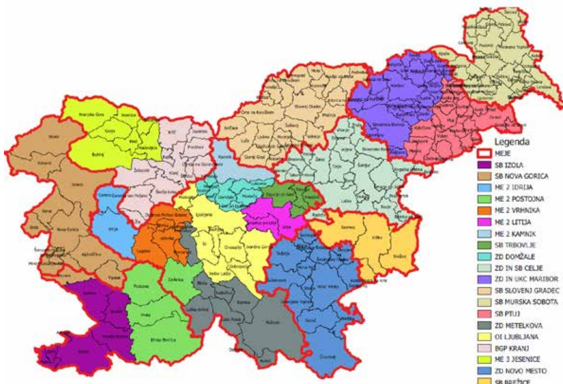
Slika 3: Zemljevid slovenskih občin glede na vabljenje ustreznih žensk v presejalno enoto programa DORA. Odebeljena rdeča črta označuje meje OE ZZZS.