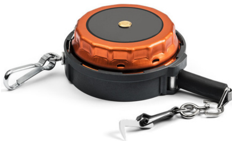
Sekaški meter

Dolžino sortimentov merimo z umerjenimi merilnimi napravami (sekaški meter), ki imajo natančnost meritev najmanj en centimeter. Merimo najkrajšo razdaljo med obema paralelnima prerezoma na obeh koncih sortimenta, pri tem iz meritve izvzamemo streho zaseka. Dolžino izražamo v metrih, zaokroženo navzdol na eno decimalno mesto. V primeru prisotnosti napake krivosti, se sortiment meri po več ravnih sekcijah. V primeru prodaje po nominalnih dolžinah se izmerjena dolžina zaokroži na najbližjo nominalno dolžino (SIST EN 1309-2, 2006).