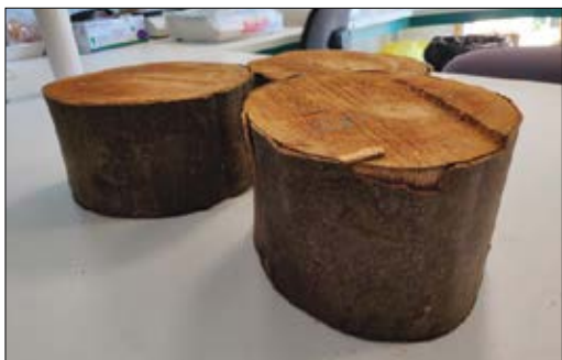
Slika 1: Koluti bukve, uporabljeni za proces umerjanja rezistografskih gosto.