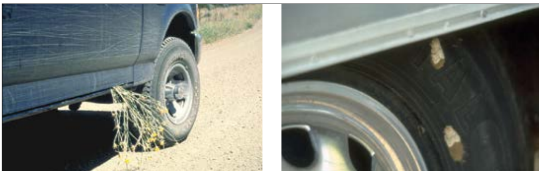
Slika 1: Primer naključnega transporta poletnega glavinca (levo) in navadnega gobarja (desno) s pomočjo vozil

Pri pregledu zakonodaje na področju gozdarstva (Zakon o gozdovih in Pravilnik o varstvu gozdov) smo zasledili nekaj osnovnih ukrepov za preprečitev širjenja in zatiranje rastlinskih bolezni in prenamnoženih populacij žuželk, ki pa ne vključujejo konkretnjših navodil. V 59. členu Uredbe (EU) 2016/2031 o ukrepih varstva pred škodljivimi organizmi rastlin so zapisana splošna določila za