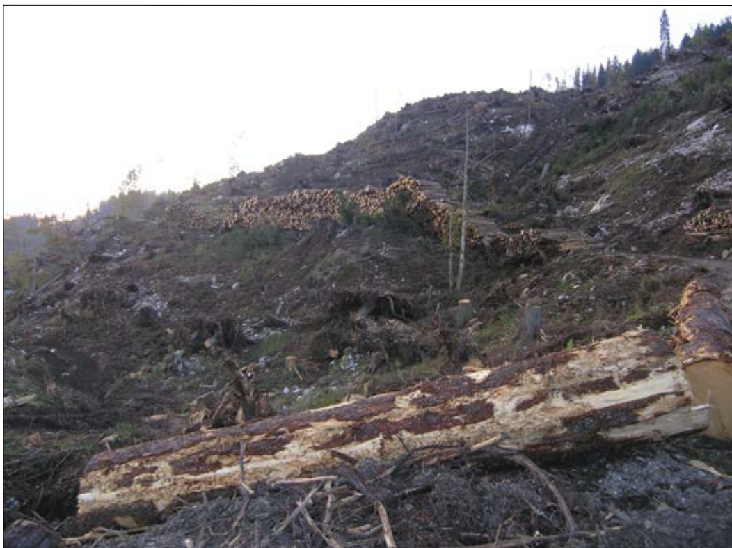
Slika 2: Zapuščina motnje. 29. junija 2006 je Jelovico prizadel orkan, ki je v manj kot 20 minutah na ozko omejenem območju na površini 106 ha podrl 85.000 bto m 3 smrekovega debeljaka. (foto: M. Jurc)

Figure 2: The legacy of a disturbance. On June 29, 2006, Jelovica was struck by a hurricane that knocked down 85.000 gross m 3 of mature spruce trees in less than 20 minutes on a narrowly limited area on the area of 106 ha. (photo: M. Jurc)