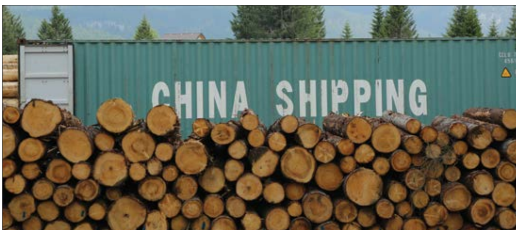
Slika 3: Poškodovan les zaradi gradacij podlubnikov v Italiji odkupuje Kitajska (severna Italija, 11. 8. 2019).

Figure 2: The legacy of a disturbance. On June 29, 2006, Jelovica was struck by a hurricane that knocked down 85.000 gross m 3 of mature spruce trees in less than 20 minutes on a narrowly limited area on the area of 106 ha. (photo: M. Jurc)