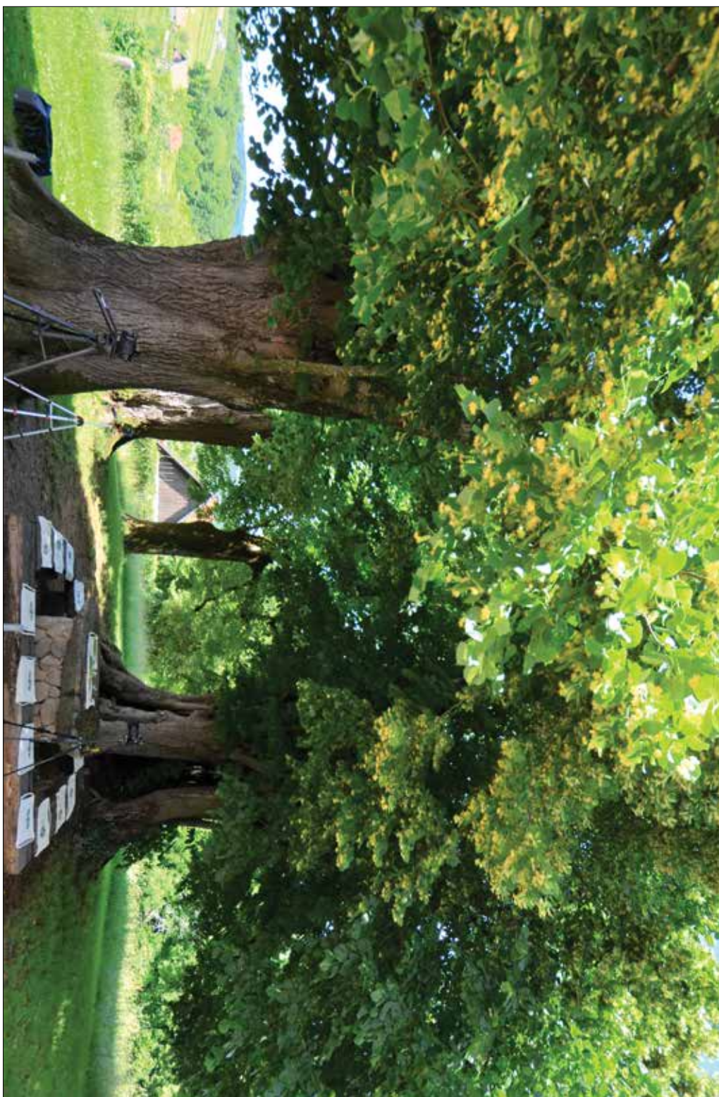
Slika 4: Pred pričetkom predstavitve knjige Čar gozda na Trški Gori