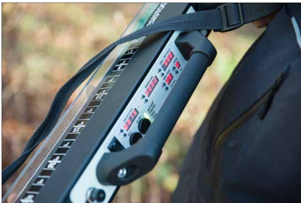
Slika 1: Rezistograf, naprava za merjenje gostote