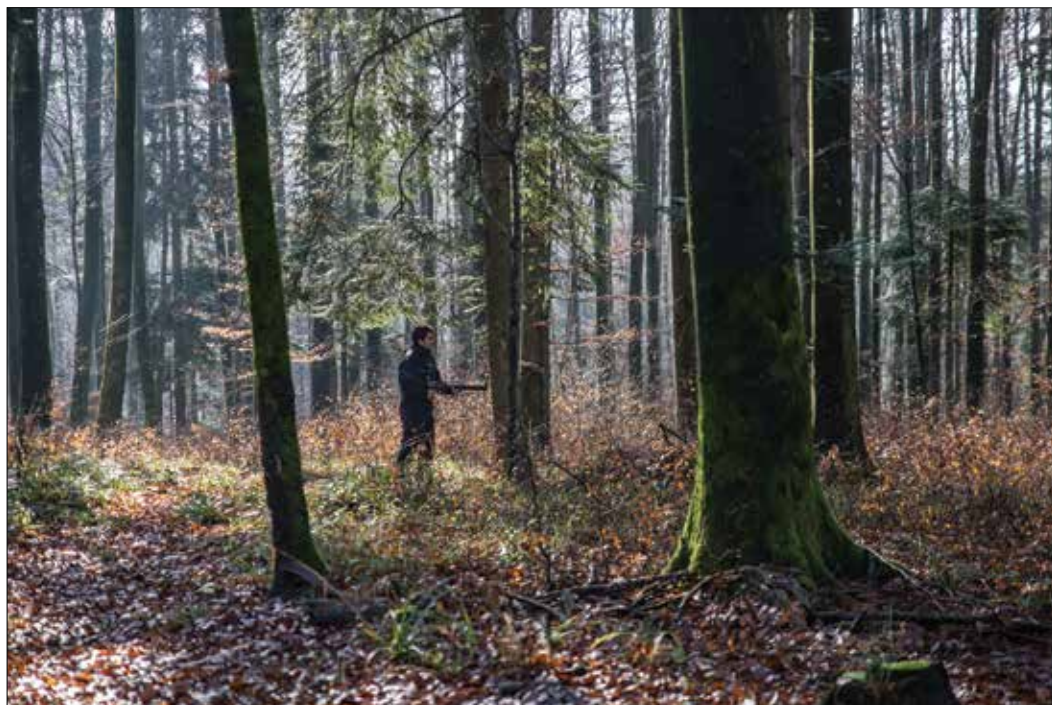
Slika 5: Vzorčenje stojčega drevesa z rezistografom