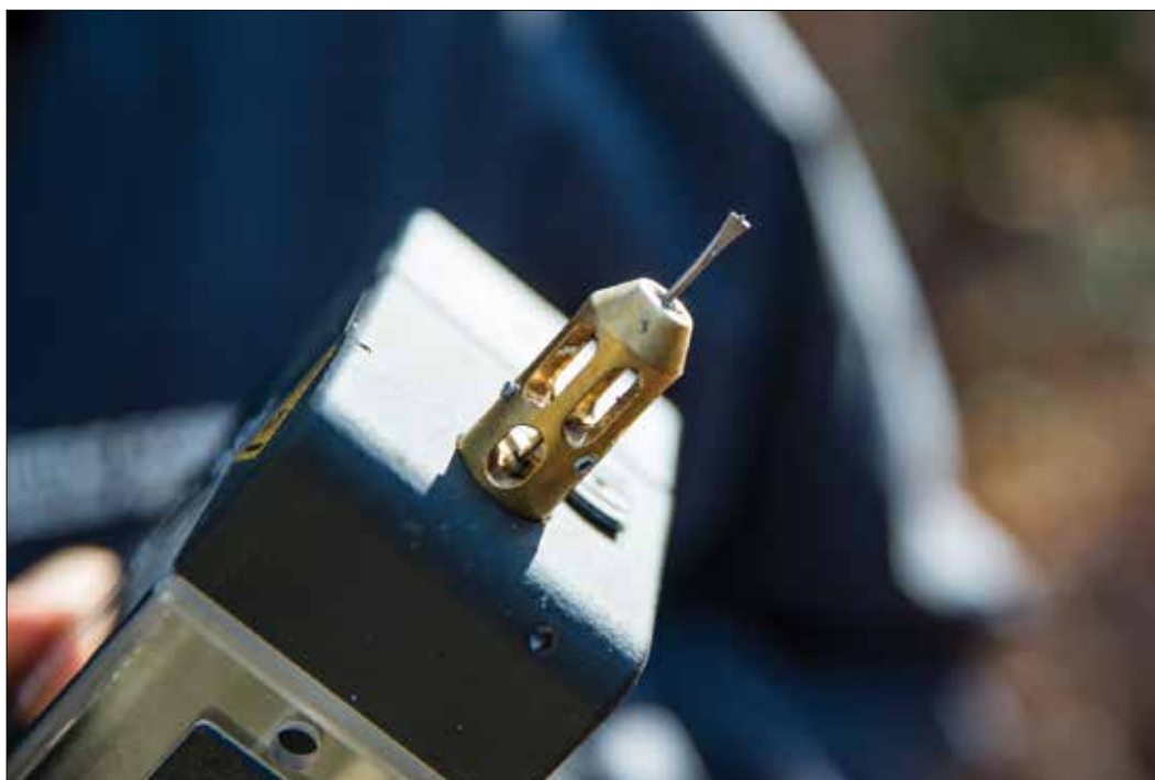
Slika 2: Sveder rezistografa