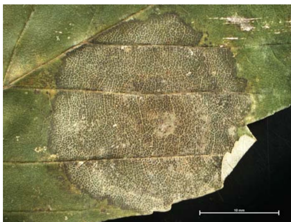
Slika 2: Sivo rjava pega