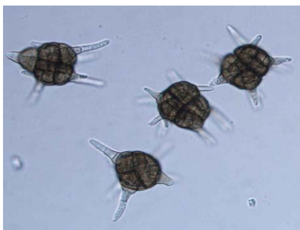
Slika 4: Konidiji glive Petrakia echinata