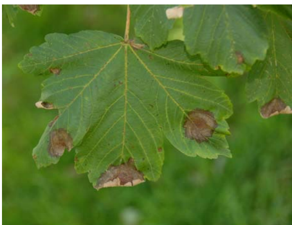
Slika 1: Pege na listu gorskega javorja

oblike, na njih pa so koncentrični kolobarji, ki kažejo, kako se gliva skokoma širi v listu v zanje ustreznih razmerah za rast. Ob močni okužbi se lahko več peg združi in na koncu obsega celotno listno površino. Gliva na pegah oblikuje nespolna trosišča – sporodohije (slika 3), ki so sprva opazni kot belkaste pike, kasneje pa postanejo rjavi in nato črni. Sporodohiji vsebujejo konidije (slika 4), ki so običajno rjavi, kroglasti do elipsasti, septirani in z dvema do šestimi izrastki, ki so ravni in brezbarvni. Ob močni okužbi gliva povzroči predčasno odpadanje listja. Z zatiranjem glive nimamo izkušenj, domnevno je učinkovita jesenska odstranitev odpadlega listja, ki naj bi onemogočila ponovno okužbo listja naslednjo pomlad. Sicer pa kakšni posebni varstveni ukrepi niso potrebni.