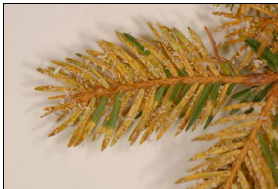
Slika 2: Na porumenelih iglicah so beli mešički; to so eciji, v katerih nastajajo eciospore