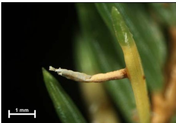
Slika 3: Eciji so lahko dolgi tudi do 3 mm, njihov ovoj, t. j. psevdoperidij, je bele barve in se po sprostitvi trosov raztrga