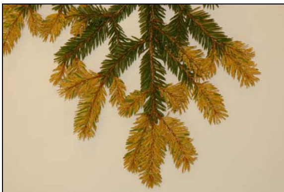
Slika 1: Letošnje iglice so porumenele; porumenelih je tudi do 100 % letošnjih iglic; porumenele iglice odpadajo

Zatiranje bolezni v naravnem okolju ne izvajamo, saj slečev ni možno izkoreniniti, poleg tega pa so še zaščiteni.