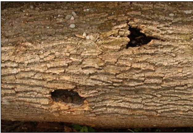
Slika 1: Jesenov glivični rak na velikem jesenu, rahlo privzdignjena skorja, skorja je razpokana z odprtino na sredini