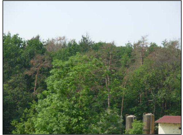
Slika 2: Pogled na gozdove z rdečim borom slabo leto po toči (Grajena pri Ptuju) – foto maj 2009