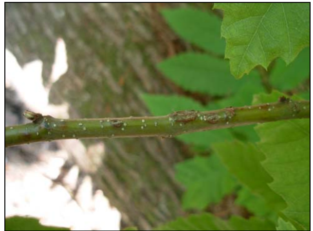
Slika 4: Poškodbe na kostanjevem poganjku – foto maj 2009