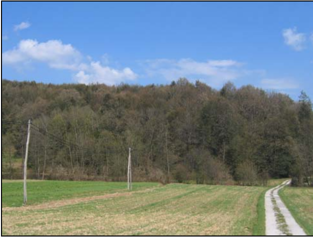
Slika 1: »Jesenski« pogled na gozdove (Grajena pri Ptuju) po neurju – foto avgust 2008