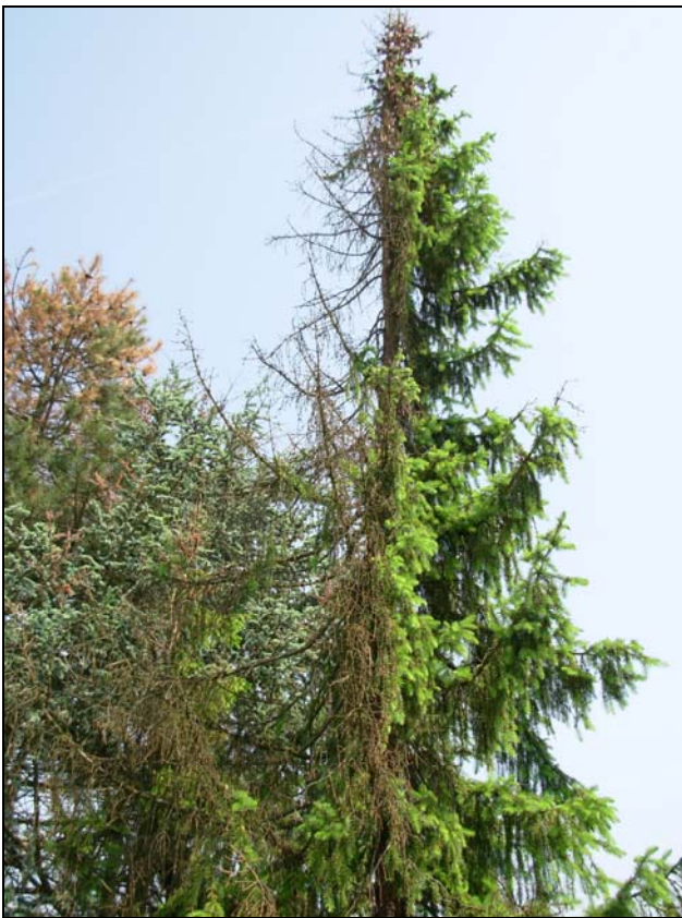
Slika 3: Poškodbe na drevju zunaj gozda (Grajena pri Ptuju) – foto maj 2009