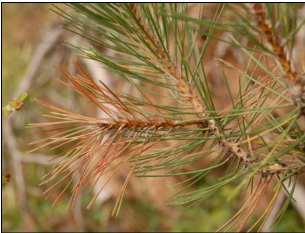
Slika 3: Ne tipičen simptom, ki ga je povzročila gliva Diplodia pinea na območju Podgorja na Krasu v letu 2008 - odmiranje najmlajših borovih poganjkov z dokončno zraslimi iglicami (pri tej bolezni navadno iglice niso dokončno zrasle)