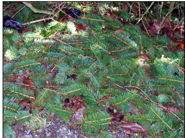
Slika 2: V zimi z debelejšo snežno odejo, lahko pod smrekami naletimo na več cm deblo plast odgriznenih vejic, katerim je popke pojedla navadna veverica