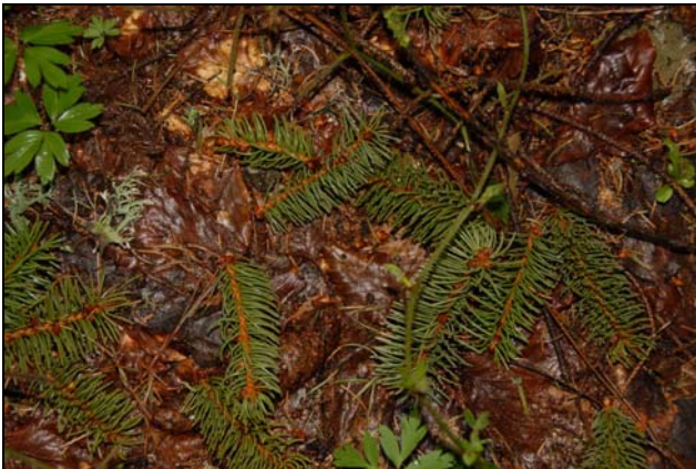
Slika 1: Odgriznjene vejice navadne smreke zaradi navadne veverice