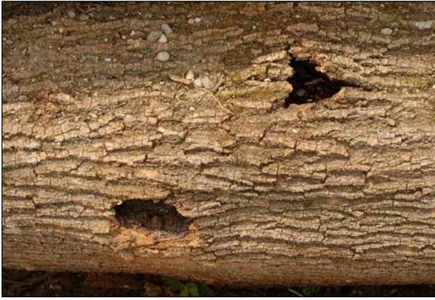
Slika 1: Jesenov glivični rak na velikem jesenu, rahlo privzdignjena skorja, skorja je razpokana z odprtino na sredini