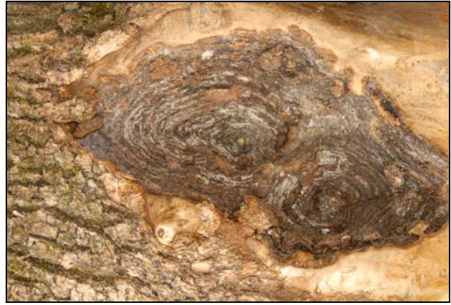
Slika 2: Pod skorjo je rak skoraj pravilne simetrične oblike