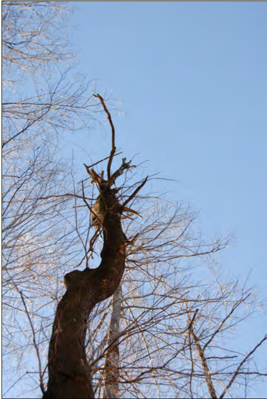
Slika 3: Na mestu, kjer izraščča grm navadnega ohmelja, se veja pogosto odlomi. Posledice so za drevo lahko tako drastične, da lahko ostane skoraj brez vej.