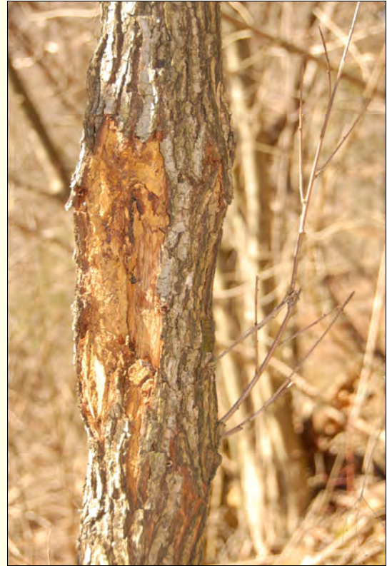
Slika 4: Gradnja je okužila gliva Chryphonectria parasitica , ki povzroča kostanjev rak.