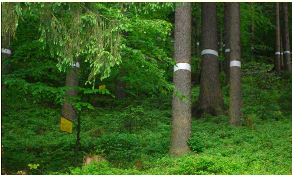
Slika 1: Zaščita dreves pred poškodbami zapredkaric je bila izvedena z namestitvijo lepljivih trakov širine cca 15 cm v prsni višini debla. Rojenje smo spremljali z rumenimi ploščami.