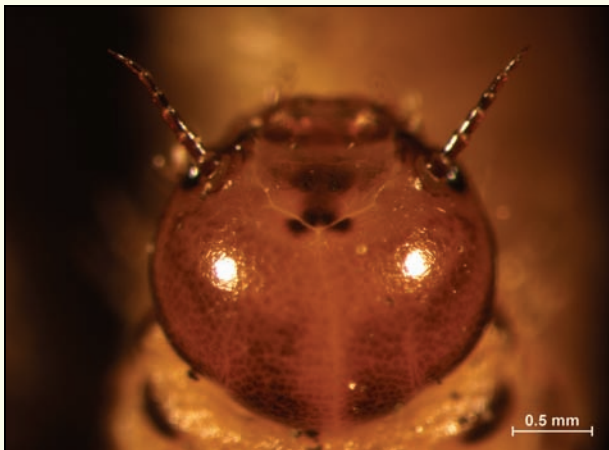
Slika 1: Poljska zapredkarica ( Cephalcia arvensis ), arhitektura glave predpupalne oblike

Univerza v Ljubljani, Biotehniška fakulteta, Oddelek za gozdarstvo in obnovljive gozdne vire, Večna pot 83, 1000 Ljubljana maja.jurc@bf.uni-lj.si