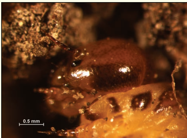
Slika 3: Glava starejše pronimfe poljske zapredkarice