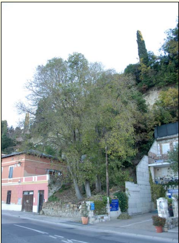
Slika 3: Napadeno drevo Celtis australis v Piranu, 3.12.2013