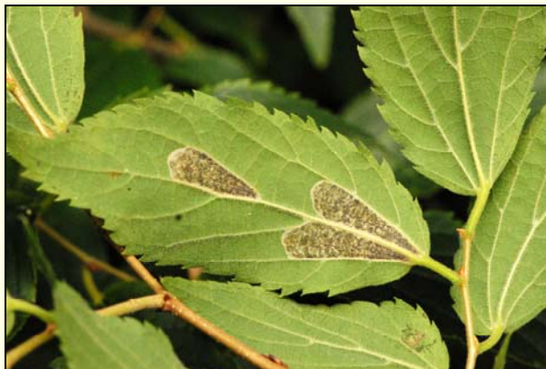
Slika 2: P. millierella , izžrtine so dobro vidne na odsonni listni ploskvi (spodnji), Dekani, 8.9.2011