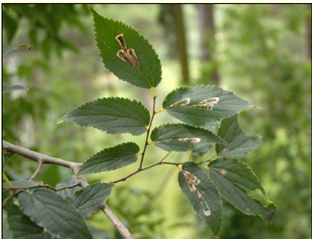
Slika 1: Listni zavrtač koprivovca ( Phyllonoricter millierella ), Dekani, 8.9.2011