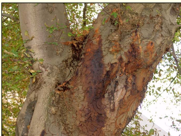
Slika 2: Izcejanje črnega soka iz skorje divjega kostanja zaradi bakterije Pseudomonas syringae pv. aesculi (Heupel in Tiede-Arlt, 2007)