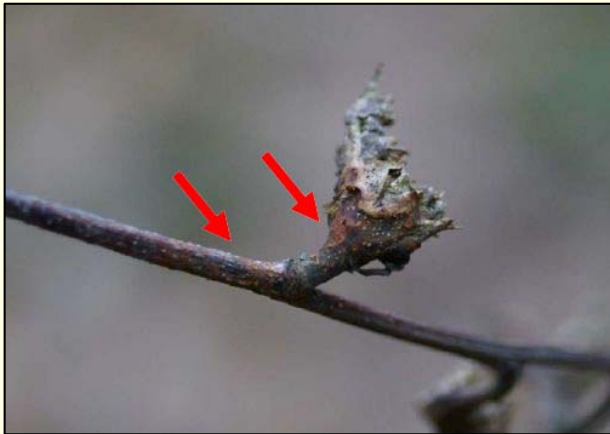
Slika 8: Odmiranje skorje zaradi glive Cryphonectria parasitica , ki je okužila vejico skozi šiško (Prospero in Forster, 2011)