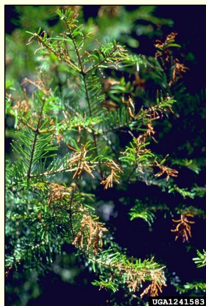
Slika 5: Odmiranje jelovih poganjkov zaradi glive Delphinella abietis