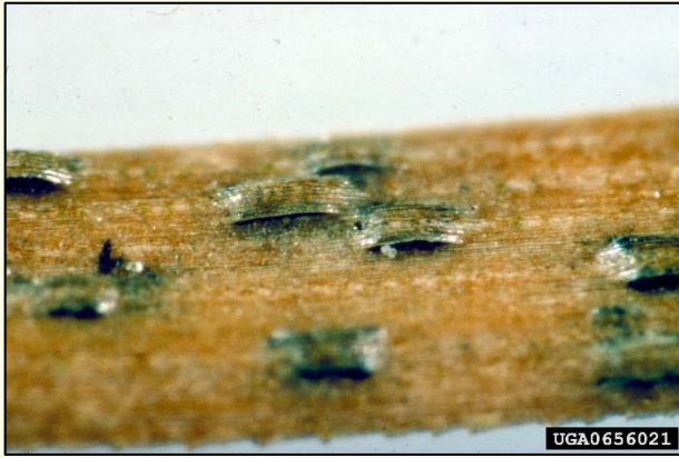
Slika 6: Trošičča glive Lecanosticta acicola na borovih iglicah