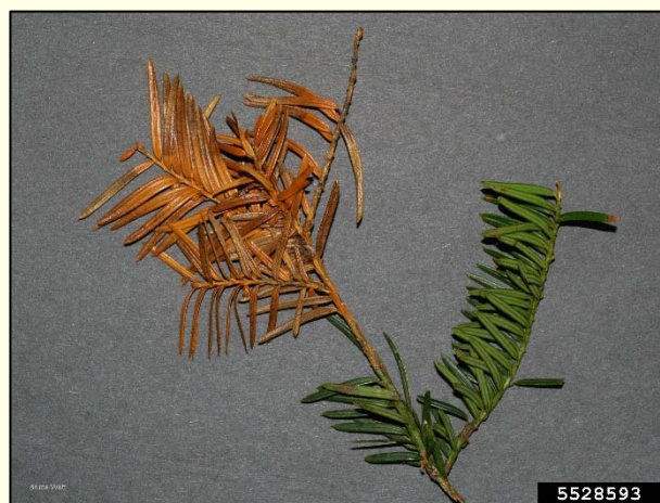
Slika 3: Odmrle iglice navadne tise in črna trosišča glive Cryptocline taxicola