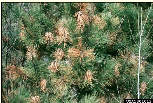
Slika 4: Sušenje poganjkov smreke zaradi glive Sirococcus conigenus