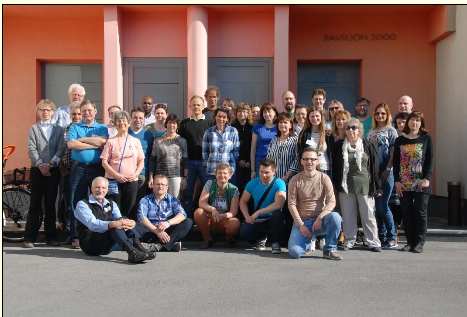
Slika 1: Skupinska slika udeležencev 18. srečanja Evropske mikološke mreže v Ljubljani 2015