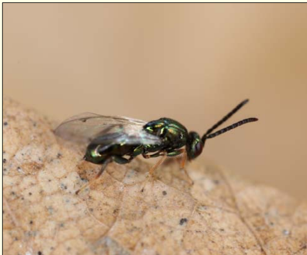
Slika 3: Samec Torymus sinensis je dolg 1.7 do 2.1 mm, marec 2016