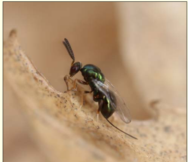
Slika 4: Samica Torymus sinensis je dolga 1.9 do 2.7 mm, marec 2016