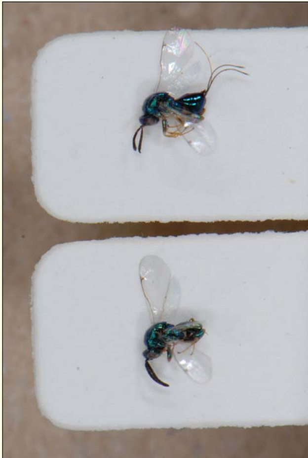
Slika 1: Preparirana primerka T. sinensis v zbirki Oddelka za gozdarstvo in obnovljive gozdne vire – entomologija, Lipa, 23. 10. 2014