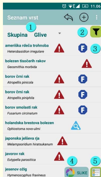
Slika 6: Seznam ITV v mobilni aplikaciji Invazivke. Legenda: (1) filter Skupina – omejeitev vrst na izbrano taksonomsko skupino organizmov; (2) besedilni filter – iskanje vrst po njihovem imenu; (3) preglednica s seznamom vrst; (4) pregled seznama vrst v obliki slik; (5) legenda pomena ikon v seznamu.