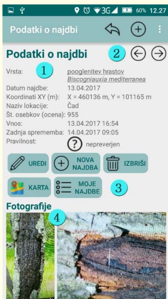
Slika 5: Obrazec s pregledom podatkov o najdbi v mobilni aplikaciji Invazivke. Legenda: (1) podatki o najdbi; (2) gumba za premikanje med zapisi; (3) kontrolni gumbi; (4) fotografije, ki so bile zajete v sklopu izbrane najdbe.