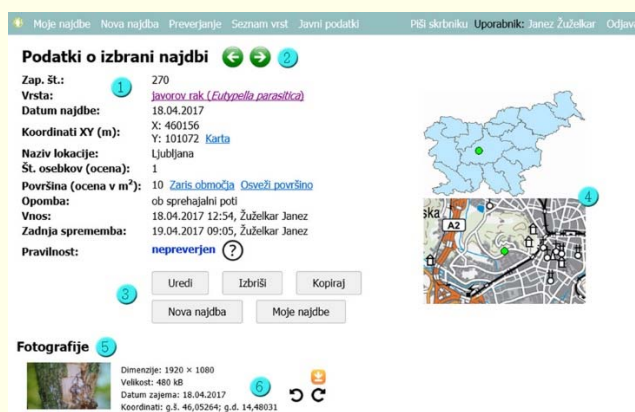
Slika 2: Obrazec za pregled podatkov o najdbi v spletni aplikaciji Invazivke. Legenda: (1) podatki o izbrani najdbi; (2) premik na naslednjo ali prejšnjo najdbo; (3) ukazni gumbi; (4) pregledni karti, ki prikazujeta približno lokacijo najdbe; (5) fotografije najdbe; (6) podatki o fotografiji in gumbi za urejanje fotografije.