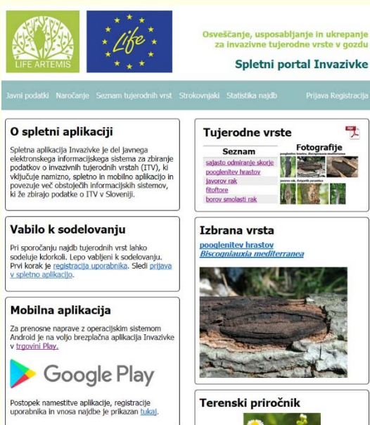
Slika 1: Domača stran spletnega portala Invazivke ( https://www.invazivke.si )

1 Gozdarski inštitut Slovenije, Večna pot 2, 1000 Ljubljana *nikica.ogris@gozdis.si