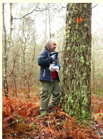
Slika 7: Prikaz odvzema vzorcev za testiranje na prisotnost borove ogorčice, Bursaphelenchus xylophilus

Usposabljanje na temo izvajanja programov preiskav v Španiji je doseglo svoj namen, saj je udeležencem na enem mestu ponudilo vse potrebne informacije na področju izvajanja programov preiskav ŠO rastlin, razjasnilo nekatera že znana dejstva in nas seznanilo z novostmi na tem področju. Ključnega pomena je bilo skupinsko delo in sodelovanje s strokovnjaki z različnih področij zdravstvenega varstva rastlin iz različnih evropskih držav, saj je intenzivna izmenjava različnih mnenj, izkušenj in dobrih praks spodbujala razvoj novih idej in predlogov za izboljšave za usklajeno izvajanje aktivnosti programov preiskav znotraj celotne EU, hkrati pa razjasnila marsikatero dilemo kako, če sploh, ukrepati v določenih primerih. Udeležba na tovrstnih mednarodnih usposabljanjih je za strokovnjake, ki delujejo v mednarodnem okolju nujna, zato se jih bomo sodelavci VARGO GIS še naprej udeleževali.