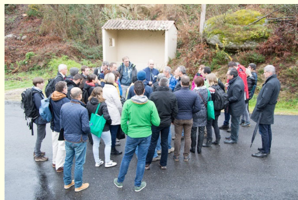
Slika 6: Predstavitev problematike na terenu

denarjem in vzpostaviti boljše sodelovanje med Portugalsko in Španijo, saj morajo biti ukrepi na obeh straneh meje usklajeni, sicer uspeh ni zagotovljen.