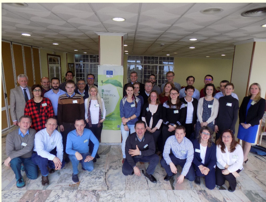
Slika 1: Udeleženci usposabljanja, skupaj z organizatorji in tutorji (foto: BTSF)

na nivoju EU na področjih zakonodaje, ki zadevajo hrano, krmo, zdravje in dobrobit živali ter zdravje rastlin, tako imenovano iniciativo BTSF (Better Training for Safer Food). Pobuda ima pravno podlago v 51. členu Uredbe (ES) št. 882/2004 Evropskega parlamenta in Sveta o izvajanju uradnega nadzora, da se zagotovi preverjanje skladnosti z zakonodajo o krmi in živilih ter s pravili o zdravstvenem varstvu živali in zaščiti živali in 2. členu Direktive Sveta 2000/29/ES o varstvenih ukrepih proti vnosu organizmov, škodljivih za rastline ali rastlinske proizvode, v Skupnost in proti njihovemu širjenju v Skupnosti. Prioritete iniciative BTSF so organizacija in razvoj strategije usposabljanj na nivoju EU s ciljem zagotavljanja in ohranjanja visokega nivoja zaščite potrošnikov, zdravja in dobrobiti živali ter zdravja rastlin, izboljšanja in uskladitve sistemov nadzora škodljivih organizmov rastlin znotraj EU ter med EU in tretjimi državami, zagotavljanja uvoza varne hrane ter zagotavljanja pravične trgovine med EU in tretjimi državami. Usposabljanja se izvajajo od leta 2006 v različnih državah, tako znotraj EU kot izven EU, namenjena pa so strokovnemu osebju, ki deluje na področju zdravja rastlin, iz cele Evrope. Usposabljanja pokrivajo različne tematike s področja zdravja rastlin, kot so izvajanje programov preiskav škodljivih organizmov rastlin, ocene tveganja škodljivih organizmov rastlin in druge.