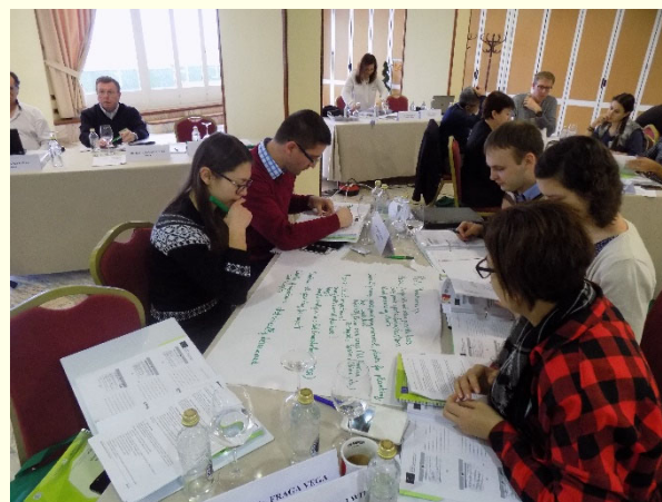
Slika 3: Delo po skupinah

Tema terenskega dela usposabljanja je bilo ukrepanje ob izbruhu borove ogorčice, Bursaphelenchus xylophilus . Gre za karantensko vrsto, ki povzroča sušenje borov ( Pinus spp.) in za katero so v primeru najdbe na območju EU predpisani strogi ukrepi za preprečevanje vnosa in širjenja. V Sloveniji ukrepe proti borovi ogorčici določa Pravilnik o ukrepih za preprečevanje vnosa in širjenja borove ogorčice (UL RS 45/09). Borova ogorčica je v Evropi zaenkrat prisotna samo na Portugalskem in v Španiji. Prvič se je pojavila na Portugalskem leta 1999, nato pa se je zaradi neučinkovitega ukrepanja razširila v sosednjo Španijo. Na Portugalskem izkoreninjenje borove ogorčice ni več mogoče, v Španiji pa z izvajanjem strogih ukrepov poskušajo preprečevati njeno širjenje.