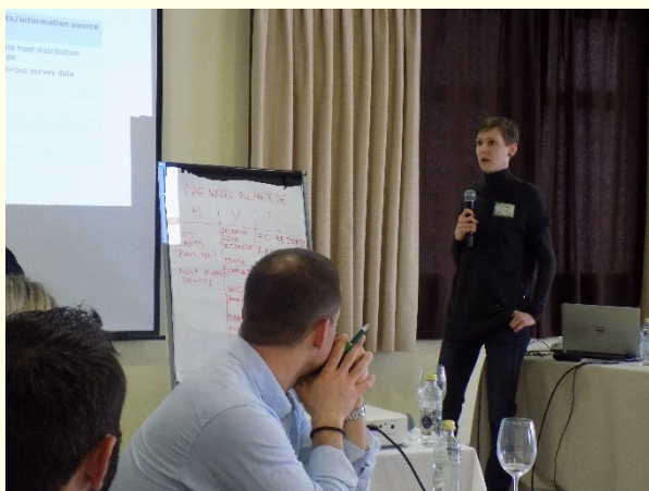
Slika 5: Predstavitev rezultatov skupinskega dela (foto: BTSF)

Glavne težave, s katerimi se pri preprečevanju vnosa in zadrževanju širjenja borove ogorčice soočajo v Španiji, so premalo strokovnega kadra in pomanjkljiva tehnična podpora za izvajanje pregledov in vzorčenj na terenu, nezadostna finančna sredstva, razdrobljeno lastništvo gozdov, ki otežkoča pridobivanje soglasij lastnikov gozdov za izvajanje ukrepov na njihovi posesti, nekontrolirani premiki lesa iz razmejitvenega območja, nezakonit posek dreves in požiganje gozdov, ki spodbujata širjenje potencialnega prenašalca Monochamus sp. in s tem povečujeta možnost širjenja borove ogorčice, ter uničevanje feromonskih pasti zaradi vandalizma. Lokalni predstavniki so poudarili, da je za večji in dolgoročno vzdržen uspeh med drugim treba povečati učinkovitost osveščanja javnosti, racionalizirati upravljanje z