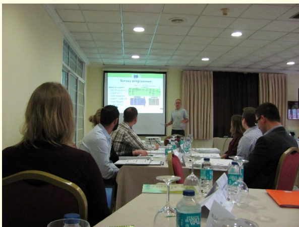
Slika 2: Teoretični del so izvajali tutorji

Z namenom zagotavljanja najvišje možne ravni kakovosti izvedbe vseh aktivnosti na področju zdravstvenega varstva rastlin, smo se tako sodelavci VARGO GIS kot tudi sodelavci ZGS v preteklih letih udeležili že več tovrstnih usposabljanj, med drugim na temo izvajanja programov preiskav (Plant Health Surveys).