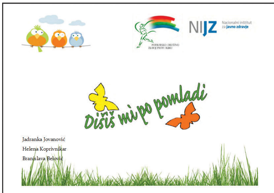
Slika 3: Naslovnica e- publikacije Dišiš mi po pomladi

Zaključna regijska prireditvev Dišiš mi po pomladi je tradicionalna. Vedno poteka ob Svetovnem dnevu brez tobaka na izbrani pomurski osnovni šoli v soorganizaciji gostujoče osnovne šole, Območne enote Nacionalnega inštituta za javno zdravje in Pomurskega društva za boj proti raku. Poudarek v programu prireditve je na scenografiji, vodenju prireditve in kulturni obogatitvi programa. Razstava izdelkov je del scenografije, ki ima iz leta v leto rdečo nit, je preprosta in prepoznavna in jo je možno dopolniti s izdelki šolarjev. Na prireditve so povabljeni vsi sodelujoči učenci, njihovi mentorji, predstavniki nevladnih organizacij, Zavoda za šolstvo RS, Zveze slovenskih društev za boj proti raku, predstavniki lokalnih skupnosti in medijev. Postavitev razstave poteka dan pred prireditvijo, kjer se na inovativen način tematsko predstavi razstava. Prireditve obsega kulturni program, predstavitev gostujoče šole ter podelitev priznanj, pohval in nagrad. Udeleženci si po končanem programu v prijetnem vzdušju ogledajo razstavo, na kateri lahko učenci spoznajo in vidijo sporočila svojih vrstnikov.