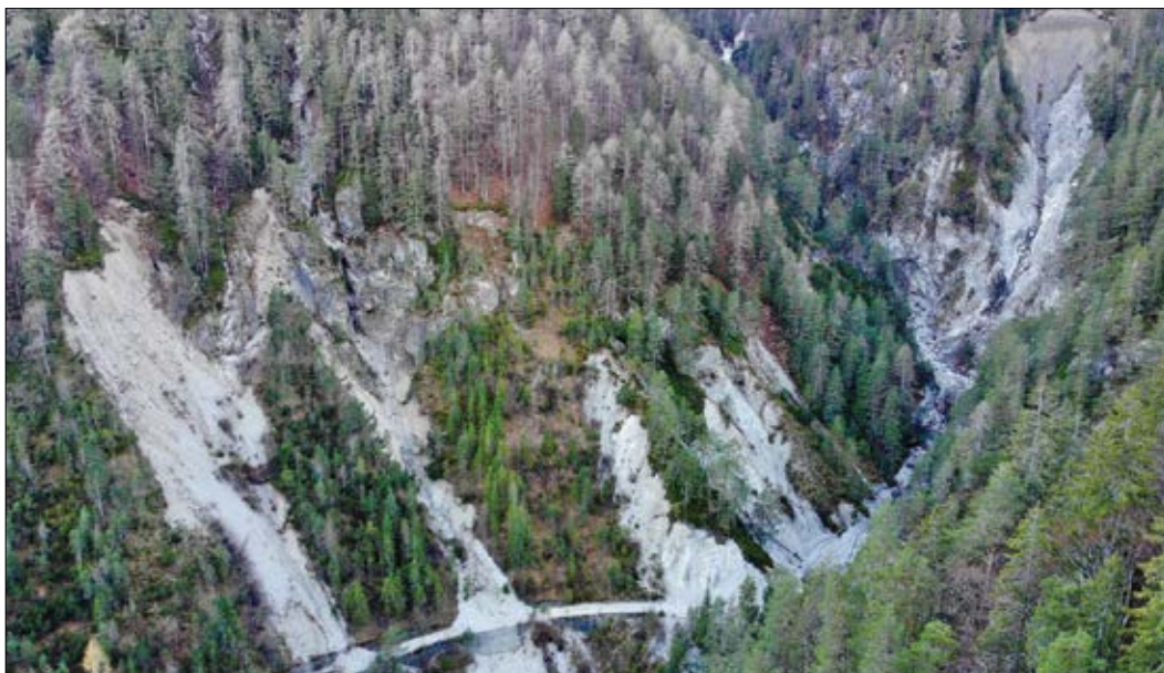
Slika 3: Posledice neurja oktobra 2018 v povirju Belce