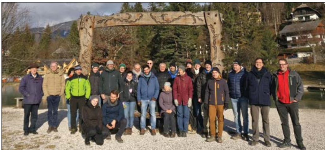
Slika 1: Skupinska slika projektnih partnerjev in predstavnikov Alpske konvencije v PAR Kranjska Gora (13.12.2018) v času delovnega sestanka projekta v Sloveniji (Ljubljana)