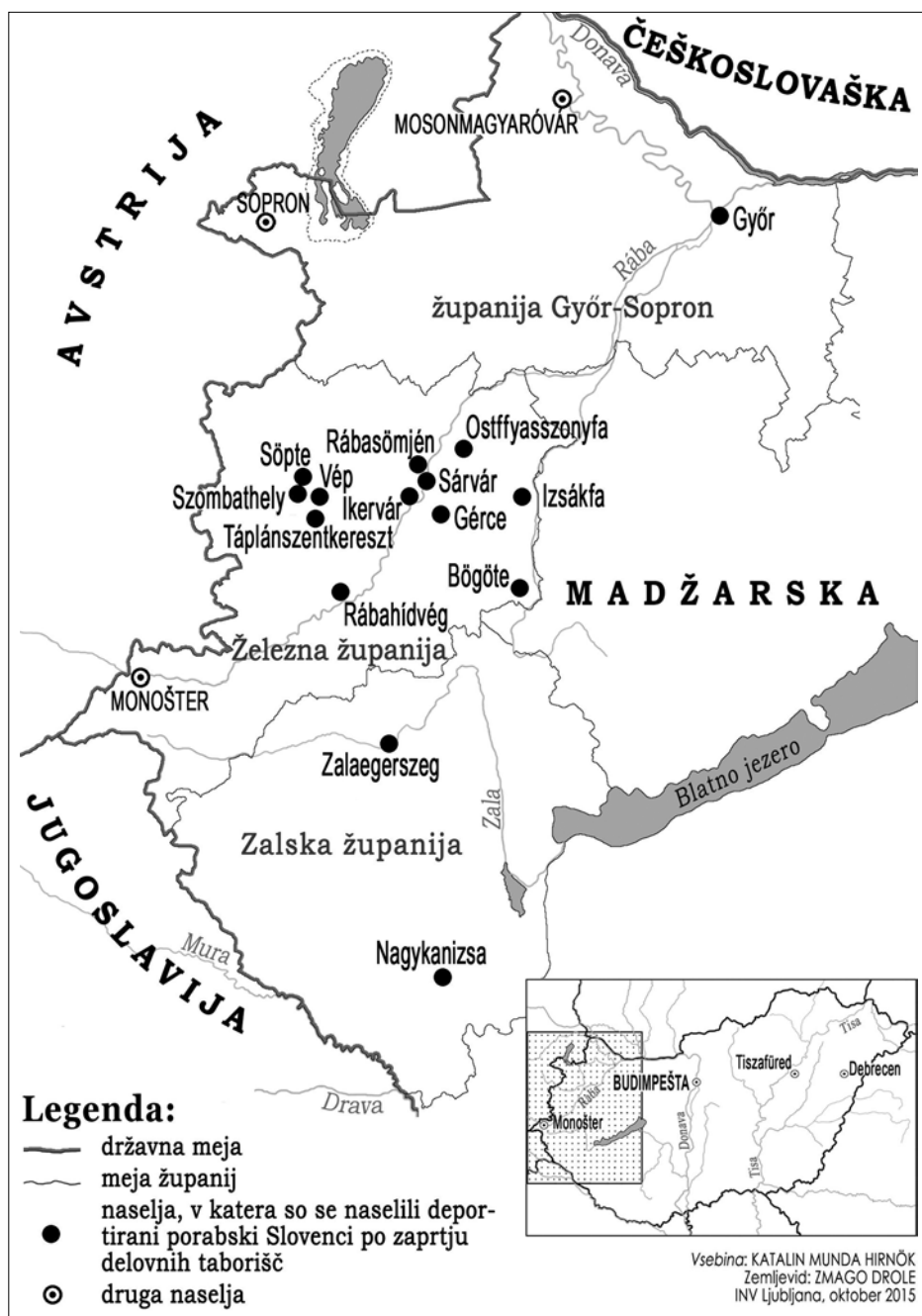
Naselja, v katera so se preselili deportirani porabski Slovenci po zaprtju taborišč leta 1953.