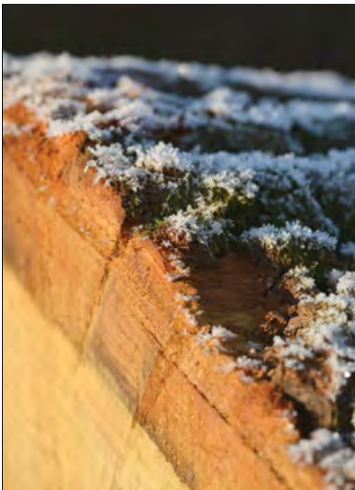
Slika 1: Les je lep

Gorski javor z najvišjo ceno za kubični meter je kupec odpeljal v Italijo. Drevo je zrastle v oko-