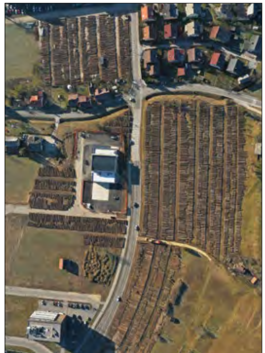
Slika 2: Pogled iz zraka