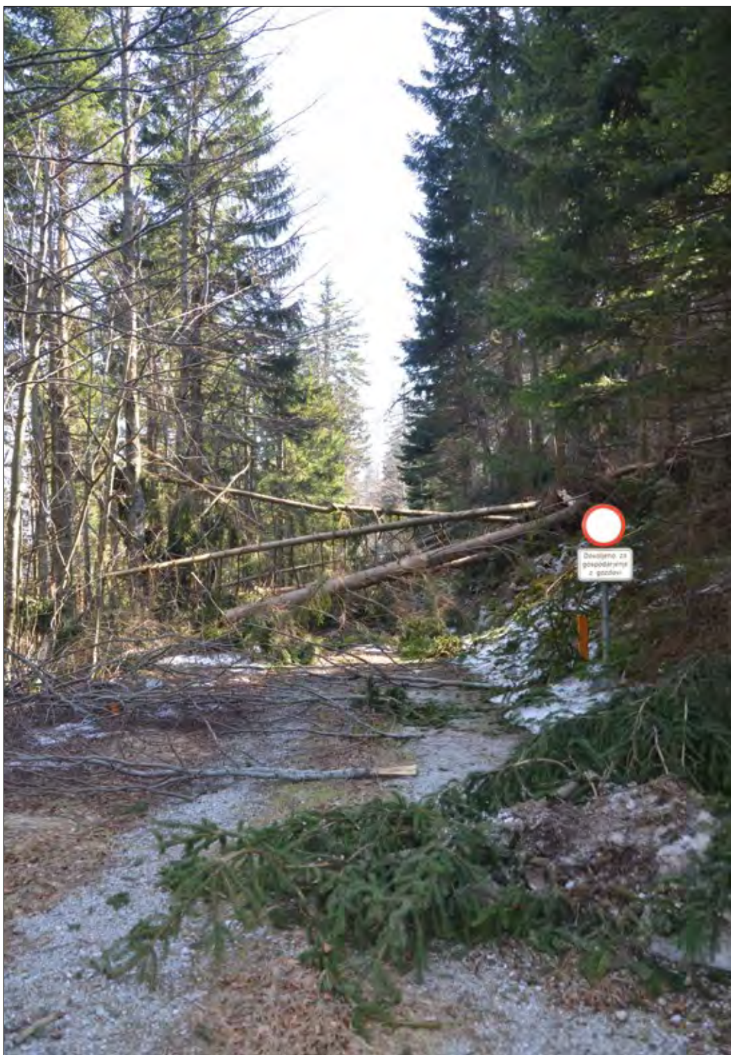
Slika 5: Zagotavljanje prevoznosti cest je ključno za uspešno in hitro sanacijo