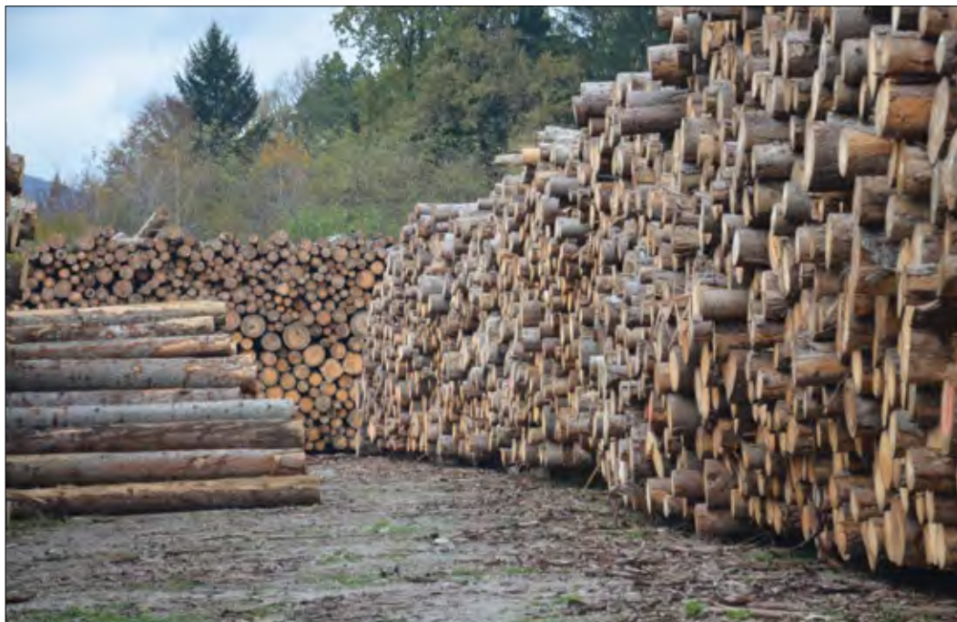
Slika 4: Večja skladišča za les lahko olajšajo in pospešijo trženje gozdnih lesnih sortimentov po večjih ujmah.

Postopke odločanja, ki so določeni s pravnimi okviri, je treba prilagoditi kompleksnim razmeram v gozdovih po naravnih ujmah, tako glede določanja rokov za izvedbo posameznih ukrepov kot glede postopkov oddaje del v gozdovih. Sistem javnega naročanja za oddajo sanacijskih del v državnih gozdovih ne ustreza potrebam delovnega procesa. Administrativne ovire lahko zelo poslabšajo učinkovitost ukrepov sanacije, zato jih je treba odpraviti, tudi s spremembo obstoječe zakonodaje in predpisov. Prilagoditev zakonodaje za učinkovito in hitro izvedbo sanacijskih del je nujna, saj so naravne ujme v gozdovih postale stalnica. Predpisi za izvedbo gozdarskih del v izrednih razmerah bi morali biti (sistemske) poenostavljeni.