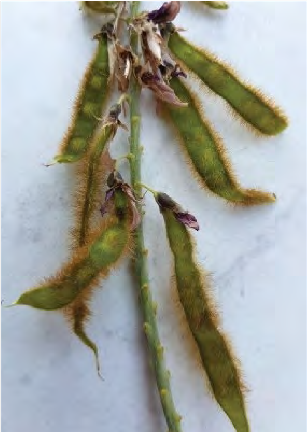
Slika 4: Kudzujevi stroki so porasli z dlačicami. Figure 4: Hairy seedpods of the kudzu plant.