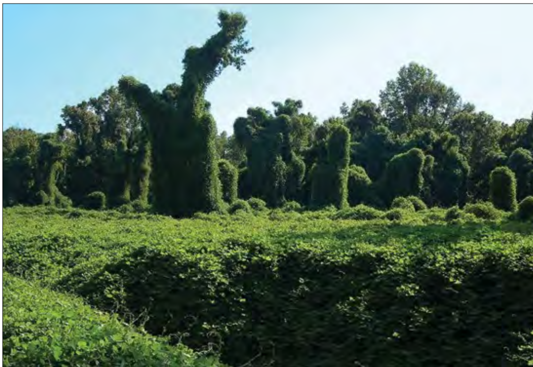
Slika 5: Popolnoma prerasla površina s kudzujem, ki se vzpenja in prerašča odrasla drevesa in drugo vegetacijo v ameriški zvezni državi Mississippi. Figure 5: A field completely covered with the kudzu plant. Kudzu climbs and overgrows mature trees and other vegetation in Mississippi, USA.

pohodništvo in opazovanje ptic (Mitich, 2000; EPPO, 2007; GISD, 2018). Ekonomska škoda, nastala zaradi občutnega zmanjšanja produktivnosti gospodarskih gozdov, je v ZDA ocenjena na 75–380 milijonov evrov na leto, letni stroški za njegov nadzor (omejevanje širjenja) pa so ocenjeni na okoli 440 evrov/ha (Forseth in Innis, 2004). Na najbolj kritičnih območjih, kjer je gosto prekril celotno pokrajino, celo omejuje vsakodnevne dejavnosti ljudi ter preprečuje normalen razvoj urbanih predelov in podeželja. Če se prosto razrašča, lahko v celoti prekrije različno infrastrukturo (npr. drogovi in žice električne in telefonske napeljave) ter zapuščene stavbe. Ogroža tudi nekatera zavarovana območja narave (Blaustein, 2001). Po vnosu v določeno okolje ga je zelo težko nadzorovati ali celo izkoreniniti, še posebno v gozdnih in robnih ekosistemih. Vendar pa so znani tudi primeri uspešne odstranitve. Tako so npr. na območju nacionalnega parka Great Smoky Mountains National Park (ZDA) v dobrih