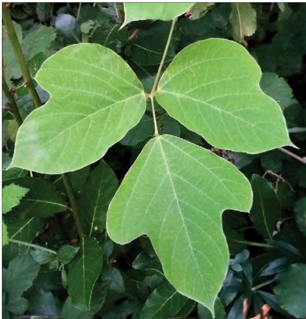
Slika 1: Lihopernato sestavljen kudzujev list; posamezni lističi so krpati. Figure 1: The compound leaf of kudzu with three lobed leaflets.

Cvetovi so vijolični do modri z rumeno liso na dnu zgornjega venčnega lista – jadra (slika 3) in imajo značilen vonj po grozdju. Večinoma se pojavljajo v nerazvejenih socvetjih, dolgih 10–25 cm. V zmernem podnebjju kudzu praviloma cveti sredi poletja ali v poznem poletju (avgust, september) (EPP0, 2007; Kus Veenvliet in sod., 2017).