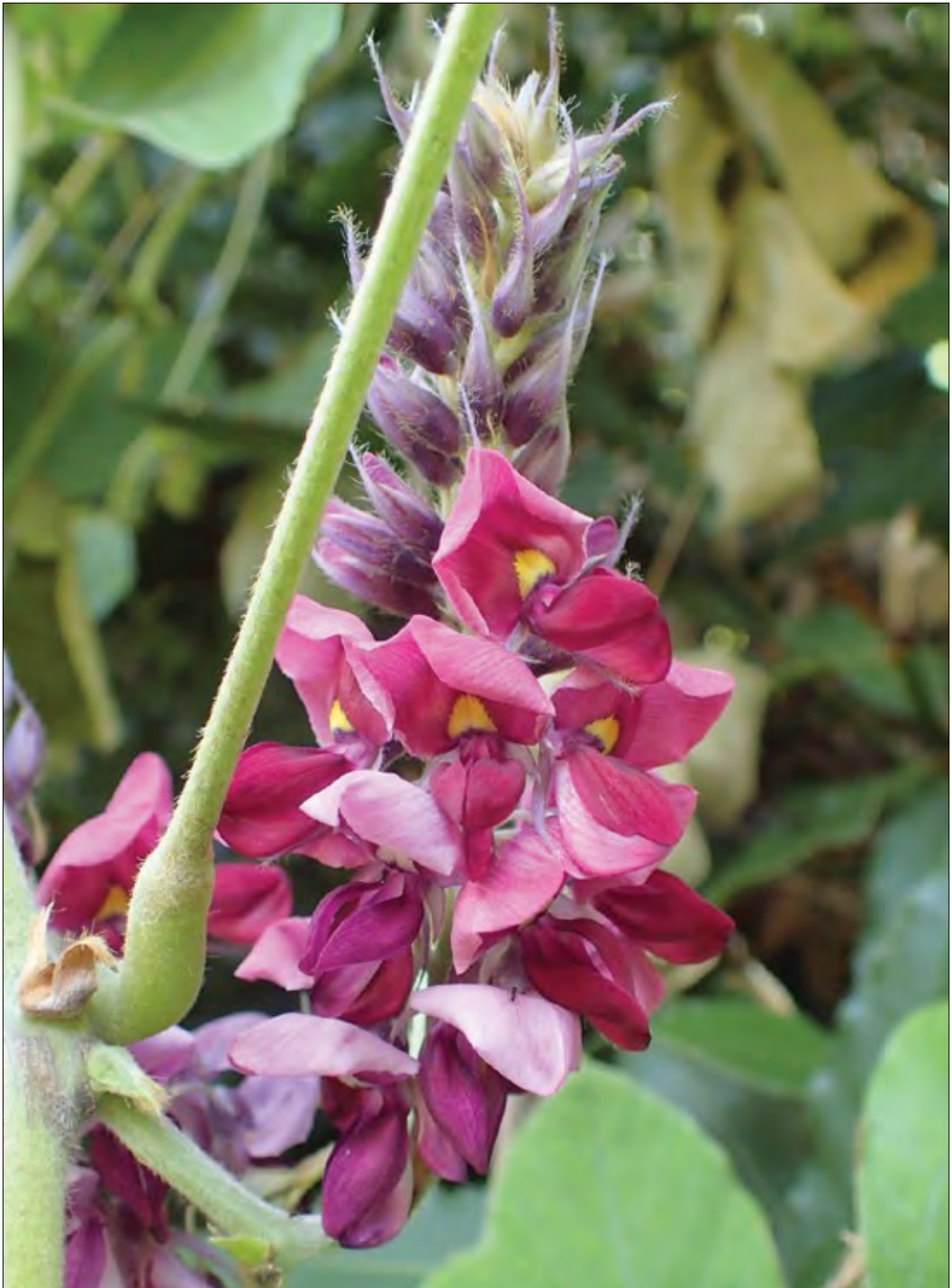
Slika 3: Pokončno kudzujevo socvetje. Cvet ima na dnu zgornjega venčnega lista (jadra) rumeno liso.

Figure 3: An upright inflorescence of kudzu. Each flower has a yellow spot at the base of its upper petal.