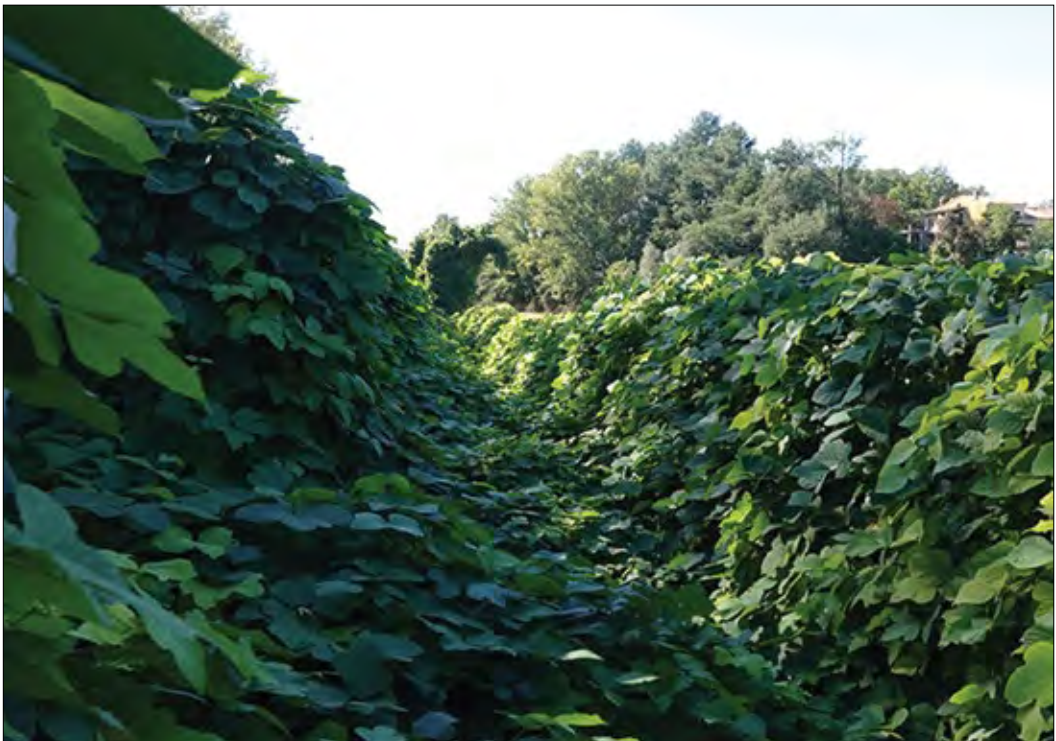
Slika 6: Zelo gosta razrast kudzuja v Dekanih

Prvi zapis v spletni portal Invazivke.si in objava v medijih o pojavljanju kudzuja v Sloveniji je sprožila odzive javnosti in uporabnikov aplikacije Invazivke.si. Tako so v septembru 2018 v informacijski sistem Invazivke.si sporočili še eno nahajališče kudzuja, in sicer v Dekanih pri Kopru, blizu reke Rižane. Terenski ogled je potrdil, da je na tamkajšnji lokaciji kudzu precej bolj razširjen kot v Strunjanu. Glede na debelino debel lahko sklepamo, da kudzu na omenjeni lokaciji uspeva že vsaj deset let. Rastlina se razrašča na površini, ki meri v dolžino okoli 150 m in 3–4 m v širino. Večinoma prerašča tla in bližnjo ograjo, vzpenja pa se tudi po drevesih. Ponekod je kompaktna »odeja« kudzuja (slika 6) debela tudi do enega metra. Glede na močno razraščeno ocenjujemo, da bo odstranjevanje kudzuja na tej lokaciji zelo zahtevno.