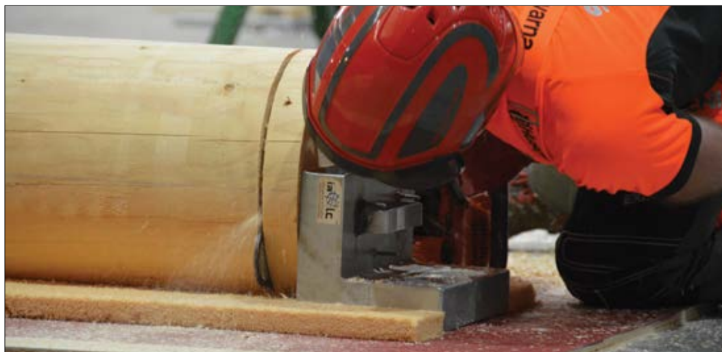
Slika 5: Janez Meden pri natančnem rezu