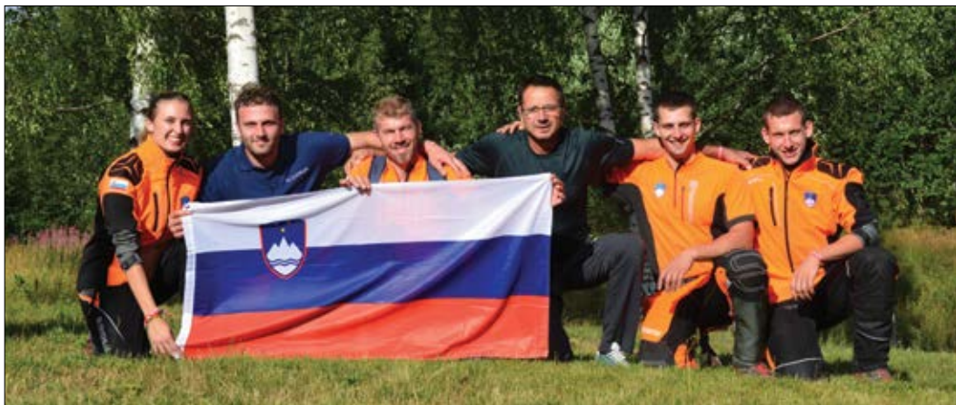
Slika 3: Slovenska ekipa s trenerjem