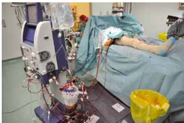
Slika 1. Perfuzor in izolirana perfuzija uda.

Pri vseh bolnikih, pri katerih načrtujemo ILP, je treba pred zdravljenem izključiti sistemski razsoj. Ob sistemskem razsoju tako agresivno lokalno zdravljenje, kot je ILP, ni smiselno. Predpogoj za njegovo tehnično izvedljivost je, da mora biti tumor omejen na okončino in ne sme segati do pazduhe ali dimelj, saj v tem primeru ne bomo mogli doseči zadovoljive izolacije in perfuzije uda. Pri razpadajočih in inficiranih tumorjih je potrebna predoperativna ciljana uporaba antibiotikov, saj lahko pri dodatnem razpadu tumorja po uspešni perfuziji pride do sepse. Pred posegom moramo vedno oceniti stanje obtoka v udu, saj je odsotnost periferne žilne bolezni predpogoj za uspešno perfuzijo. Globoka venska tromboza predstavlja kontraindikacijo za ILP. Najpogosteje izoliramo iliakalno ali femoralno arterijo in veno za ILP spodnje okončine ter aksilarno ali brahialno arterijo in veno za ILP zgornje okončine. Operativni poseg, katerega zelo pomemben del je sistemska heparinizacija, je zato vedno v splošni anesteziji in endotrahealni intubaciji. Ker je med posegom glavna nevarnost uhajanje citostatika v sistemski krvni obtok, moramo ligirati vse kolaterale in namestiti še Esmarhov turnike za kontrolo kolateral v podkožju in mišicah.