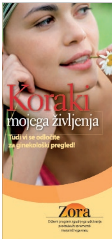
Slika 1. Prva stran zgibanke Programa ZORA.

tudi minimalno tveganja za nastanek raka materničnega vratu. Prav zato priporočamo, da se jemanje brisov materničnega vratu začne šele po začetku spolnih odnosov. Z odvzemom brisa materničnega vratu namreč odkrivamo spremembe celic materničnega vratu, ki jih povzročajo HPV. Pri ženskah, ki še niso imele spolnih odnosov, je kakovosten odvzem brisa materničnega vratu nemogoč.