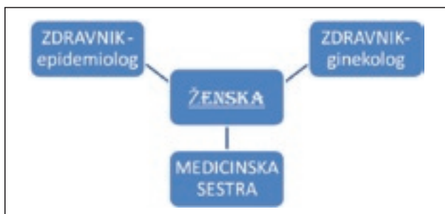
Slika 2. Udeleženci komunikacije z ženskami.