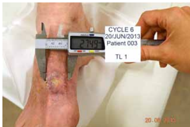
Slika 5. BCK po 32 tednih zdravljenja z vismodegibom: viden je dober odgovor na zdravljenje