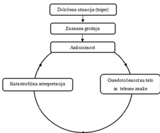
Slika 1: Kognitivni model panike (2).

Ob čustvenem odzivu na strah se stopnjujejo telesni znaki anksioznosti, kot so mišična napetost, spremembe v dihanju, tiščanje v prsni in palpitanje. Ob tem se poveča posameznikova osredotočenost na telo in na telesne znake, kar privede do poslabšanja stanja s katastrofično interpretacijo situacije in »krog« panike je zaprt (2).