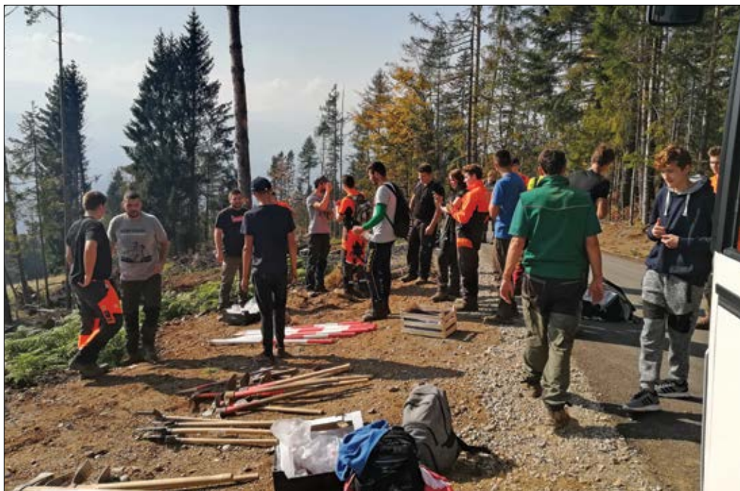
Slika 5: Posebej smo bili veseli, da sta se nam na Pohorju pridružili skupini mariborskih in koroških dijakov.