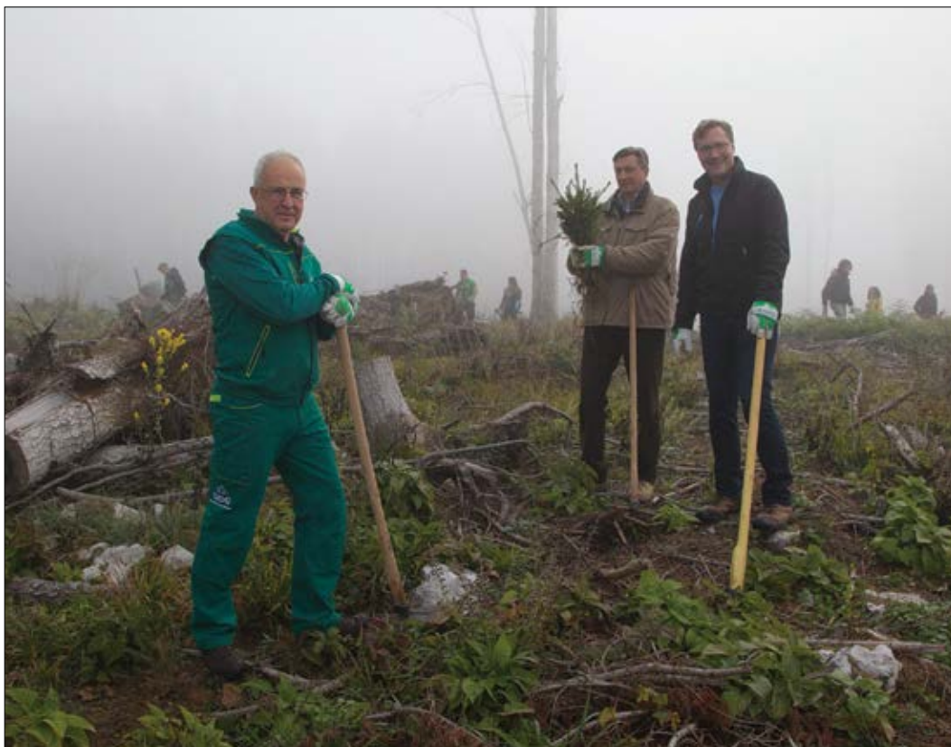
Slika 4: V Kočevju, kjer je sadil tudi predsednik države, se je zbralo preko 170 prostovoljcev, tako da je sadik kmalu zmanjkalo.