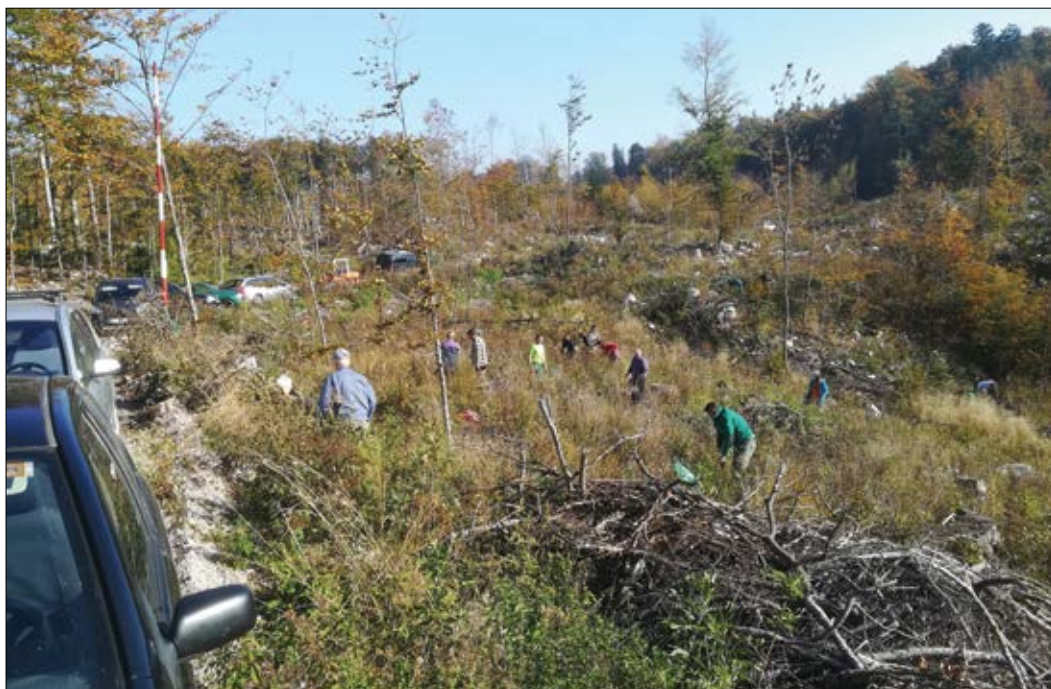
Slika 6: Na Trnovem nad Novo Gorico je udeležence, ki so se dan odločili preživeti v naravi, za trud nagradilo toplo sončno vreme.