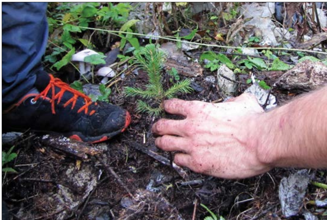
Slika 3: Posadili smo več kot 10.000 sadik mladega drevja, med katerimi so prevladovale sadike smreke.