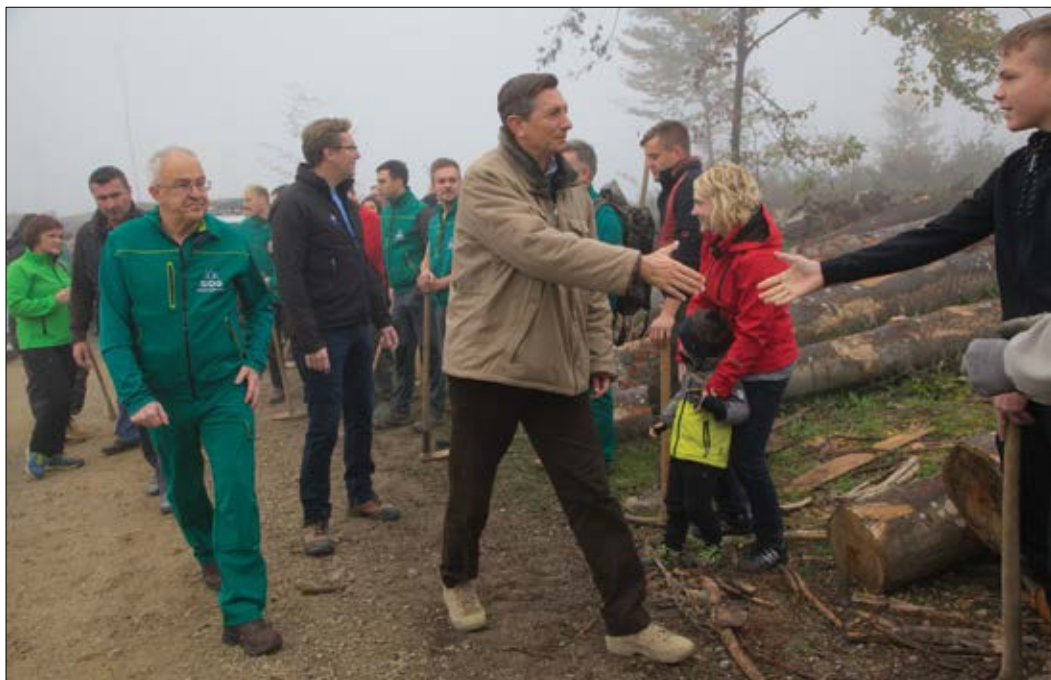
Slika 2: H kreptivi zavesti o pomenu pogozdovanja in ohranjanja gozdov je s svojo udeležbo na pogozdovanju pomembno prispeval tudi predsednik države Borut Pahor.