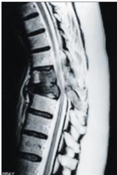
Slika 2. Metahroni metastazi v prsni hrbtenici s patološkim kompresivnim zlomom in blago utesnitvijo hrbtenjače z ventralne smeri zaradi lokalnega širjenja zasevka v spinalni kanal. Zasevka raka dojke sta se pojavila po 6 letih z nenadno lokalizirano bolečino. Metastatski proces je omejen na vse dele obeh prizadetih vretenc. Pacientka je brez nevroloških izpadov in je pokretna s tritočkovnim steznikom. Predvidena je dvojna korpektomija, nadomeščanje odstranjenih vretenc s kostnim avtolognim presadkom in stabilizacijska osteosinteza.

Nevrokirurgija je kljub tehnološkemu napredku le ena od paliativnih metod pri zdravljenju rakave bolezni z razsojem v