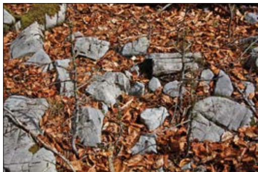
Slika 2: Mladje jelke spomladi, potem ko je pozimi padlo drevo uničilo zaščitno ograjo (Rog).

Veliki rastlinojedi parkljarji so vključeni v številne procese v razvoju gozdnega ekosistema, vplivajo npr. na energijske tokove, kroženje oz. premeščanje hranil in strukturo tal. Pri kroženju hranil sicer največji del poteka preko nižje razvitih živalskih vrst, vendar VRP povečujejo hitrost in kakovost kroženja in s tem razpoložljivost hranil. S selektivnim objedanjem, drgnjenjem in lupljenjem v mladostnih razvojnih fazah vplivajo tudi na sestojno zmes odraslih sestojev in obliko razrasti odraslih dreves (Gill in Beardall, 2001). Na primer: